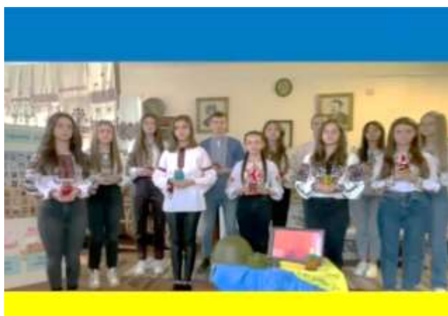
Захід до Дня Героїв Небесної сотні, учні 7-А, педагог-організатор Вей

З початком російсько-української війни у 2014р. Рада музею розпочала дослідницько- пошукову роботу із збору матеріалів про героїв нашої громади, що віддали своє життя у боротьбі з ворогом. Оформлено стенд про загиблих випускників і батьків учнів школи. В 2022р. стартував учнівський проєкт (учні 10-А класу) “Вічна пам'ять героям” , що стане основою нової експозиції музею.