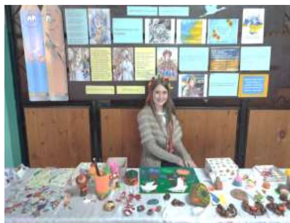
виставка-ярмарка творчих поробок 7-Б кл., збір коштів на тепловізор для ЗСУ