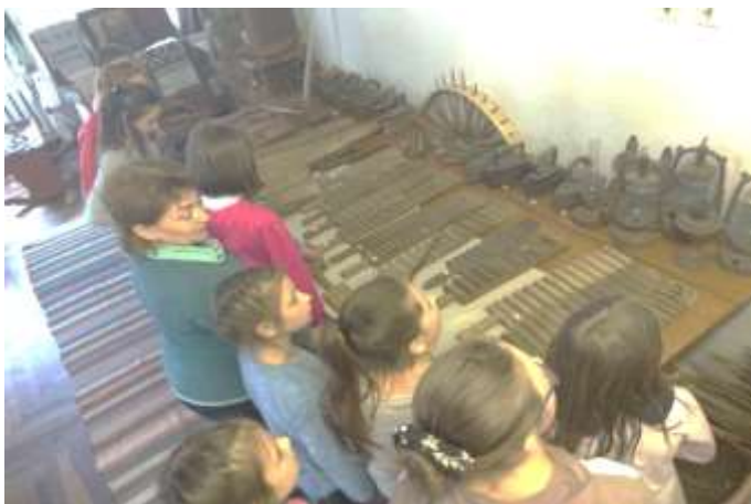
“Життя первісних людей”, Шишка Л.Г, 6 клас

Рада музею, юні екскурсоводи і учителі-предметники систематично проводять оглядові і тематичні екскурсії.