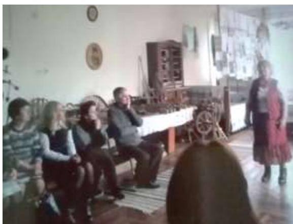
Семінар заступників директорів ЗЗСО, жовтень 2018р.

На базі музею проводились різноманітні шкільні і міські семінари методоб'єднань учителів історії, географії, початкових класів, заступників директорів ЗЗСО міста з НВР, методистів методкабінету відділу освіти Новороздільської міської ради. Головною темою завжди було національно-патріотичне виховання учнівської молоді, її всебічний розвиток задля побудови демократичної, висококультурної і європейської держави України.