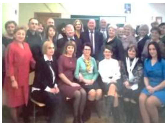
Семінар методистів методкабінету відділу освіти, лютий 2020р.