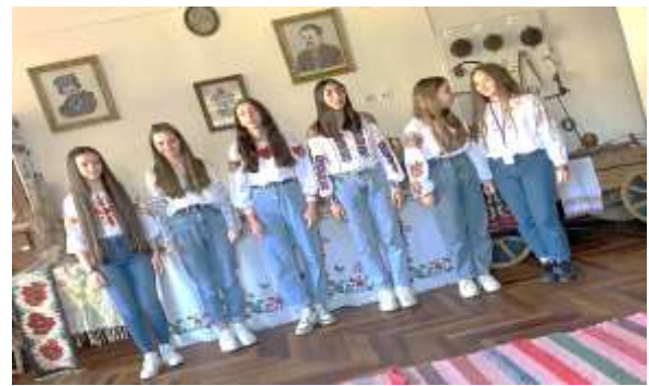
Свято української писемності, 8-Акл., 09.11.2022р.