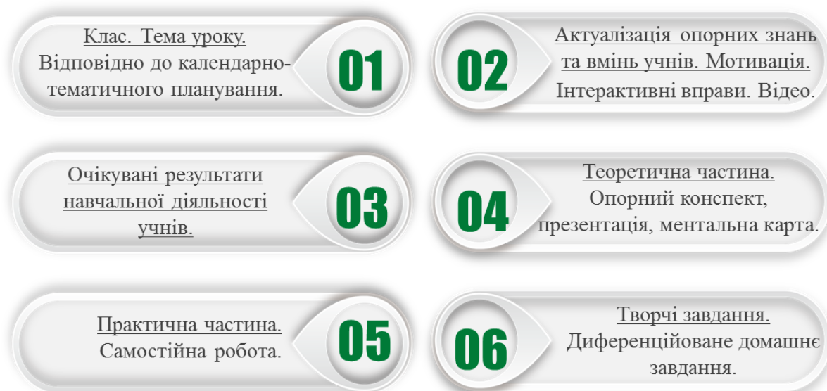
Рисунок 1 – Кейс уроку з трудового навчання

1. Координацію освітньої діяльності здійснювати за допомогою кейсу уроку. Підготувати та розмістити конспекти уроків (відео, практичні завдання, тести тощо) на обраній платформі (закладу освіти або вчителя) (рис.1).