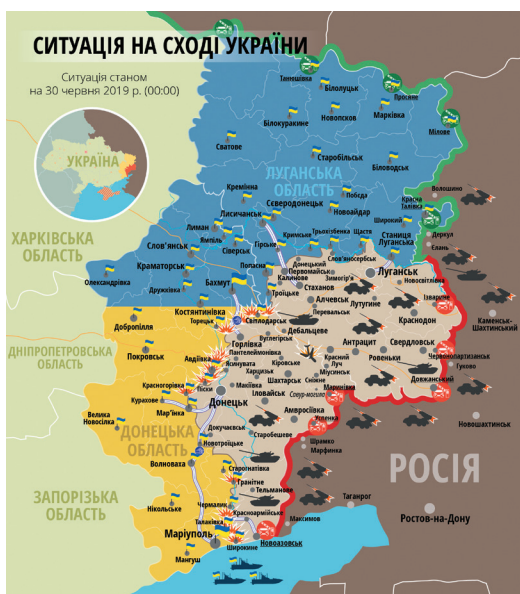
Карта ООС (АТО) станом на 30.06.2019, за даними РНБО України

А на майданчиках дитячих гуляє вітер, Порожня гойдалка там, де вчора були діти, І в тиші нелюдській, мов ті скриплячі ґрати, Луна довічний сум твоєї втрати...