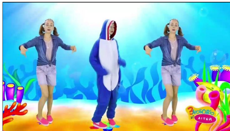
КРОКОМ РУШ - Baby Shark Українською - З Любов'ю до Дітей 1:33 відео PADLET DRIVE

Повторюй цей веселий танок разом зі мною, можеш навіть підспівувати.