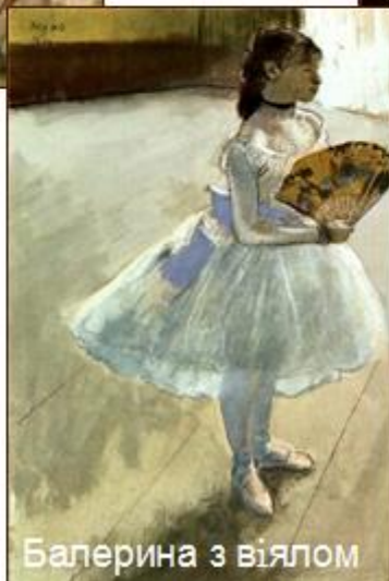
Балерина з віялом

Прагнучи зробити свій танець легким, повітряним, танцівниці намагалися встати на кінчики пальців, що привело до винаходу пуантів, розвитку техніки жіночого танцю.