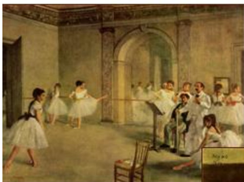
Балетний клас 1872