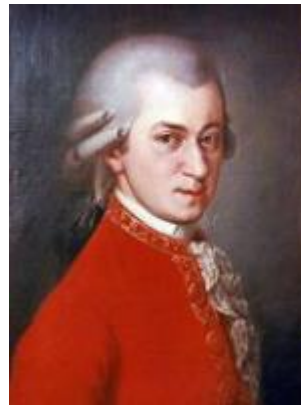
Вольфганг Амадей Моцарт (1756 — 1791)

Австрійський композитор, представник віденського класицизму, який вважається одним із найгеніальніших музикантів в історії людства. Музика Моцарта стала вершиною класичної епохи за чистотою мелодії та форми.