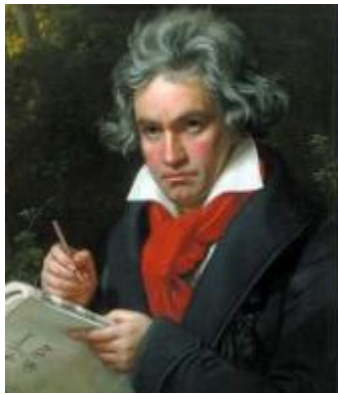
Людвиг ван Бетховен