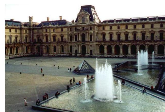
Лувр, Париж, Франція