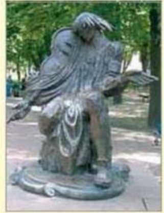
Пам'ятник М. Березовському в м. Глухові

Італійський період був найщасливішим у житті М. Березовського — тут цінували його талант, виконувалися інструментальні твори, опера «Демофон» ставилася під час карнавалу. Тому й контраст між життям за кордоном і в Петербурзі виявився різким. Після повернення в Росію композитор зрозумів, що тут його талант і досвід нікому не потрібні. Російські вельможі надавали перевагу іноземним музикантам, а М. Березовський міг розраховувати лише на скромну посаду співака-хориста у Придворній співочій капелі. Упродовж певного часу він сподівався, що його запросять очолювати Катеринославську консерваторію, яку планувалося відкрити в Україні, однак усе це виявилось порожніми обіцянками. Незважаючи на життєві труднощі, він писав високохудожні духовні концерти, які заклали основи хорової музики в українській і російській культурі.