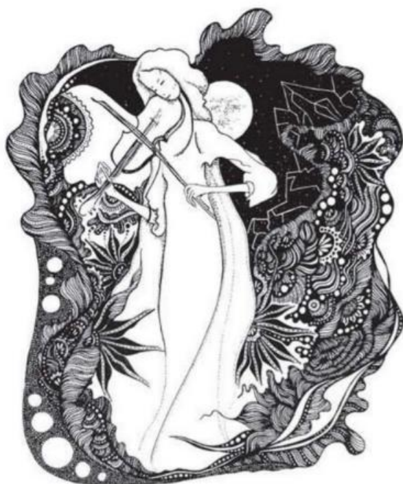
А. Вера. Місячна соната