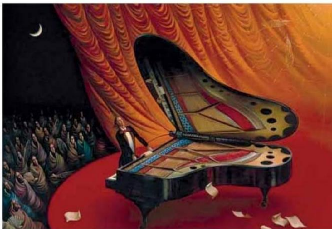
В. Куш. Місячна соната

Людвіг ван Бетховен, Соната №14 для фортепіано (Місячна соната), 1 частина.