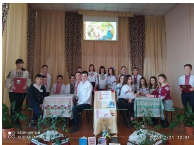
Інтелектуальний турнір «Барви рідного слова»