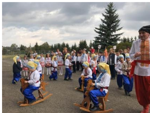
Вишкіл куреня Б.Хмельницького