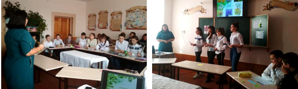
Засідання МО класних керівників «Використання новітніх технологій у вихованні ціннісного ставлення до природи» на базі 8 класу

отримували нові знання, набували корисного досвіду, яким ділилися з колегами. Кожен із класних керівників намагається відшукати свої шляхи вирішення здавалося одних і тих же завдань. І чим вища майстерність класного керівника, тим результативнішим є процес виховання: менше конфліктів, більше доброти і взаєморозуміння у взаєминах між педагогом і його вихованцями. Помітно впроваджуються нові форми роботи, прагнення йти в ногу з часом. Працювати й творити в інтересах дитини задля дитини.