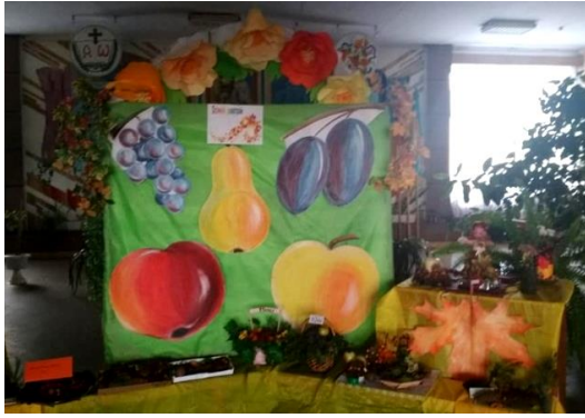
КТС «Осінній калейдоскоп»