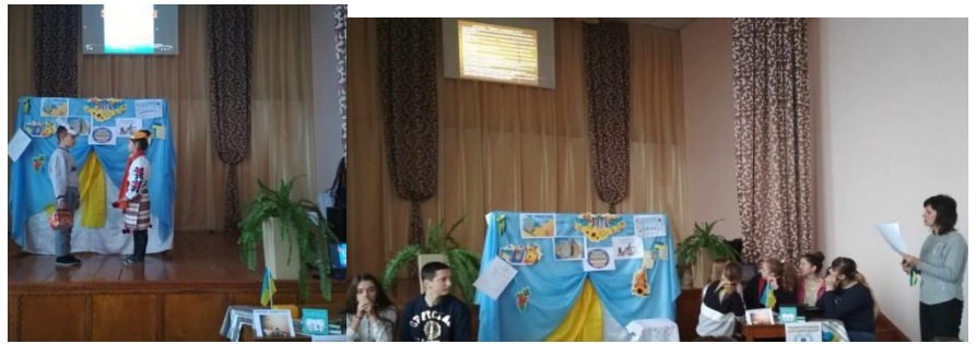
Всеукраїнський тиждень прав людини «Людина та її права»