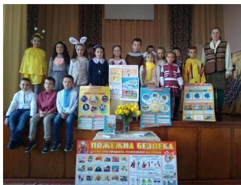
Тиждень безпеки життєдіяльності