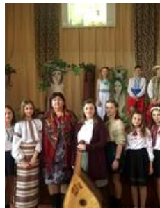
Літературно-музична композиція " Дівчина з Полісся»