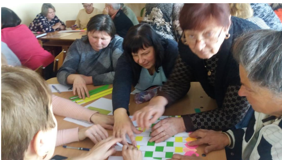
Творча майстерня педагогів