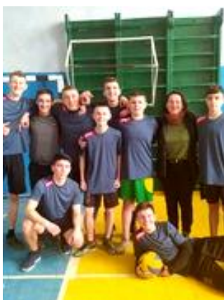
Змагання з волейболу

Ліцеїсти брали участь у змаганнях, іграх, турнірах на першість ліцею, ОТГ і району.