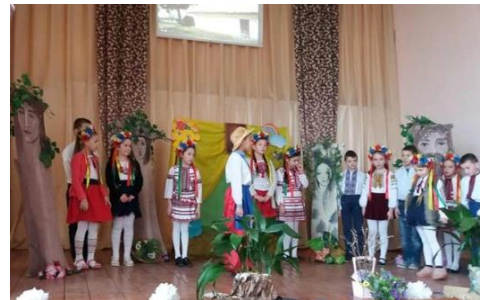
«Ми чуємо тебе, Кобзарю, крізь століття»

«Ціннісне ставлення до себе» , основним завданням якого є забезпечення повноцінного розвитку ліцеїстів, охорони та зміцнення їх здоров'я, утвердження здорового способу життя. Було проведено: