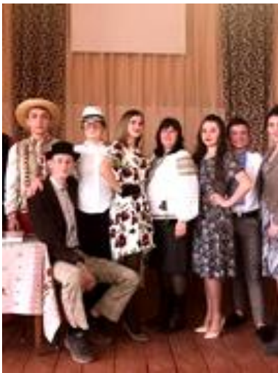
Вистава за твором фантазія М.Куліша "Мина Мазайло»

Формування в учнів різнобічних потреб самореалізації творчого потенціалу в різних сферах діяльності й спілкуванні, розвиток дитячих обдарувань через систему позаурочних форм роботи та ефективну взаємодію сім'ї та школи є основним завданням напрямку «Ціннісне ставлення до культури і мистецтва» . Найбільш значущими заходами цього напрямку стали: - до Міжнародного дня музики - музична перерва «Танцюють всі»; - до Дня працівників освіти святкове привітання; - до Міжнародного дня художника виставка робіт «Я малюю Україну»; - новорічно-розважальна програма «Новорічна фантазія»; Лунали бурхливі оплески для ліцеїстів 11 класу, які майстерно зіграли виставу «Наталка- полтавка» у сільському будинку культури.