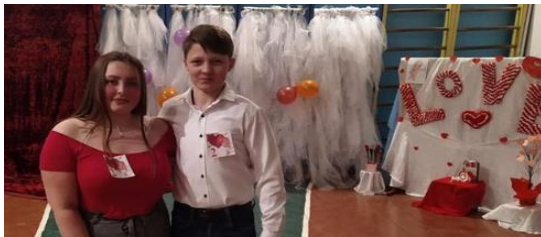
«Під знаком Купідона»

З метою пропаганди позитивного іміджу сім'ї та її соціальної підтримки, формування культури сімейних стосунків, підвищення відповідальності батьків за виховання дітей, проводилися різноманітні зустрічі разом з батьками.