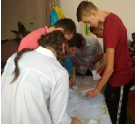
Вибори органів учнівського самоврядування

семестр , згідно плану роботи. Міністерства організовували і брали участь у проведенні тематичних тижнів, лінійок, свят, вечорів, в екологічних та волонтерських акціях.