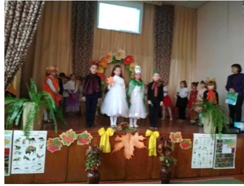
Захід «Екологічна пошта»

Формування в учнів різнобічних потреб самореалізації творчого потенціалу в різних сферах діяльності й спілкуванні, розвиток дитячих обдарувань через систему позаурочних форм роботи та ефективну взаємодію сім'ї та школи є основним завданням напрямку «Ціннісне ставлення до культури і мистецтва» . Найбільш значущими заходами цього напрямку стали: - до Міжнародного дня музики - музична перерва «Танцюють всі»; - до Дня працівників освіти святкове привітання; - до Міжнародного дня художника виставка робіт «Я малюю Україну»; - новорічно-розважальна програма «Новорічна фантазія»; Лунали бурхливі оплески для ліцеїстів 11 класу, які майстерно зіграли виставу «Наталка- полтавка» у сільському будинку культури.