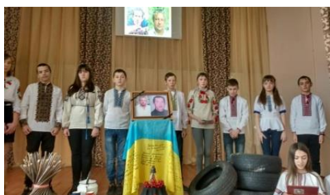
Година пам'яті "Небесній Сотні – шана й молитви"