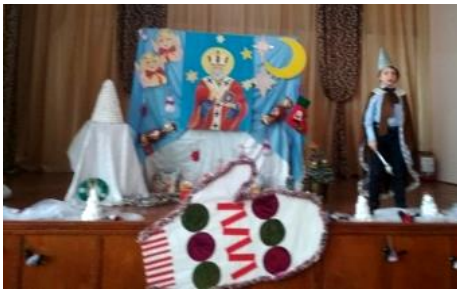
«Миколай, Миколай, Ти до нас завітай»