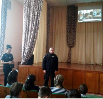
Зустріч « Протидія булінгу»