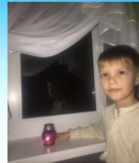
Всеукраїнська акція «Запали свічку пам'яті»