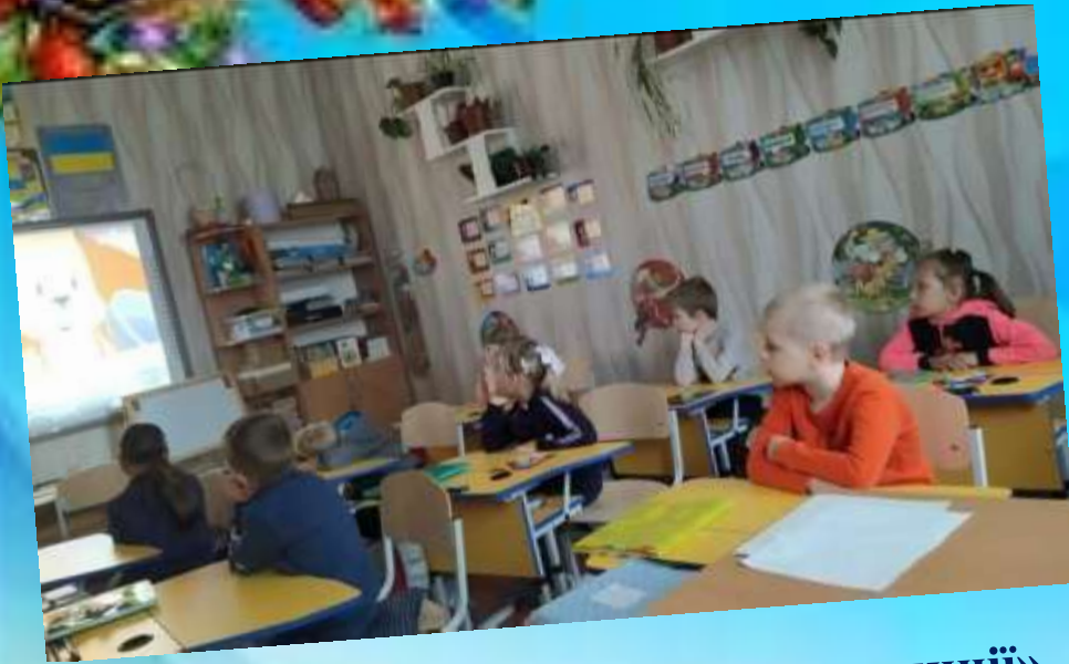
Урок ЯДС «Сімейні свята та традиції»