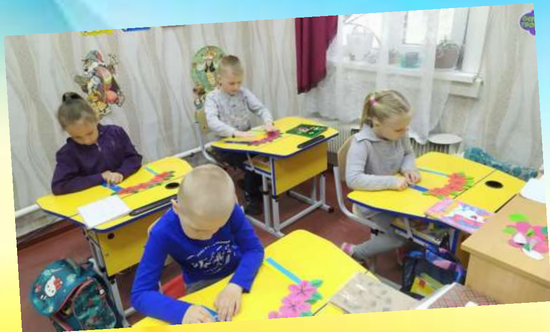
Виготовлення на уроці "Дизайн і технології" аплікації "Віночок дружби» до Дня Європи