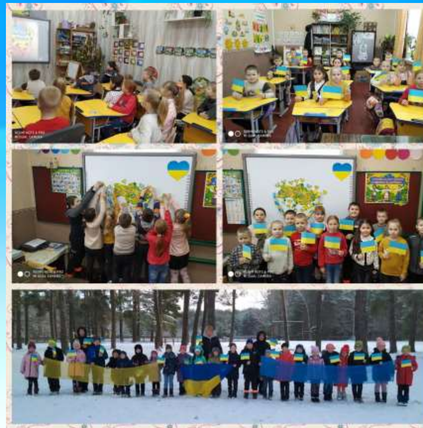
Патріотичний урок "Україна в нас єдина, бережи її, дитино"