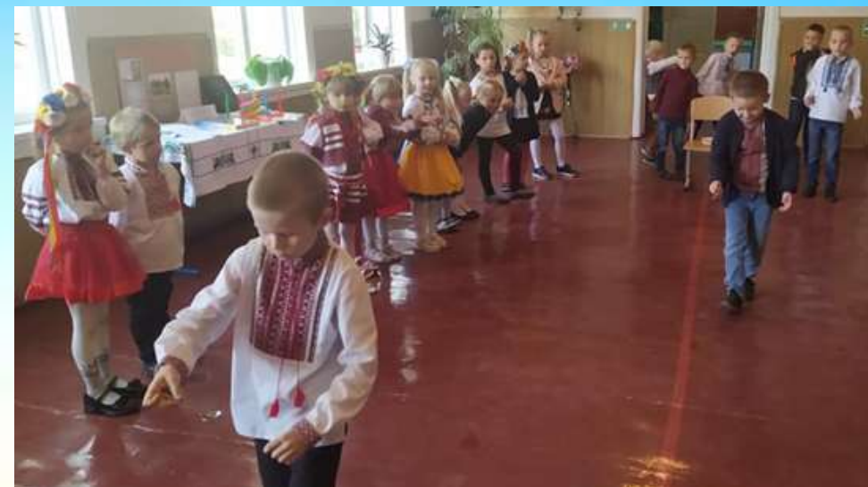
Спортивні розваги "Ми – нащадки козаків"