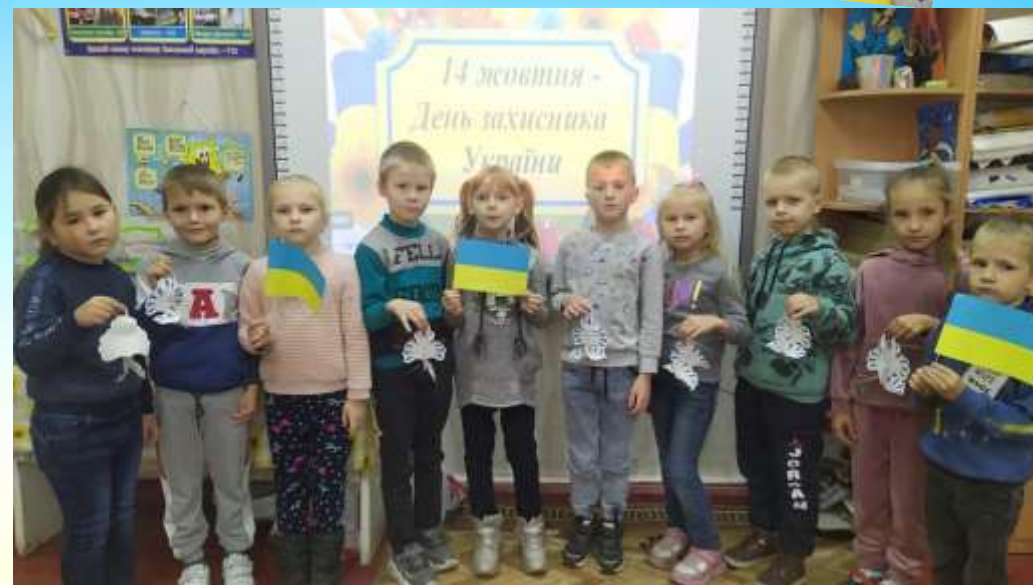
Урок мужності "На захисті Батьківщини"