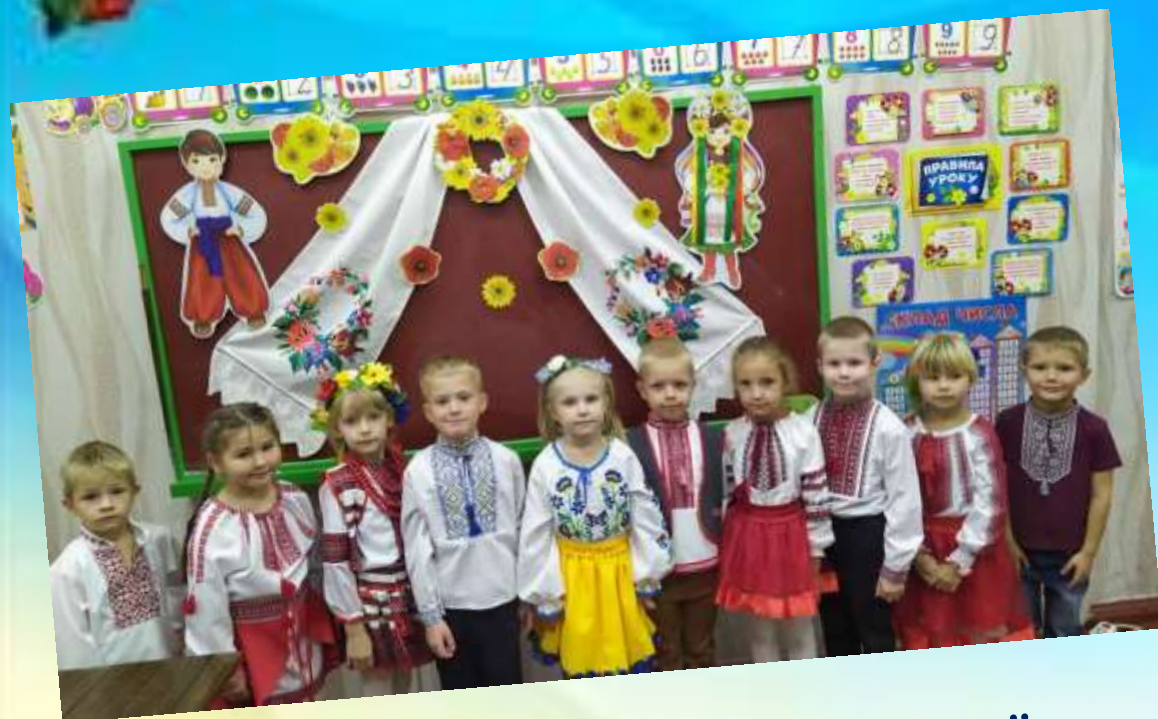
Виховна година "Ми - козацького роду"