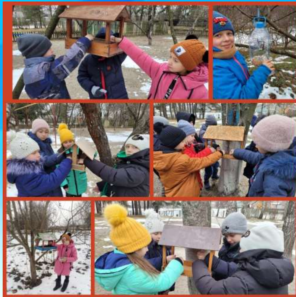
Екологічна акція "Допоможи птахам взимку"