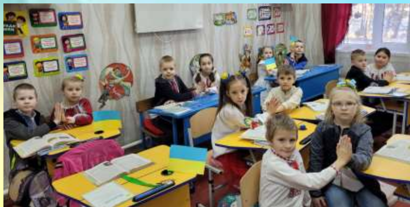
Акція «Долоньки миру»