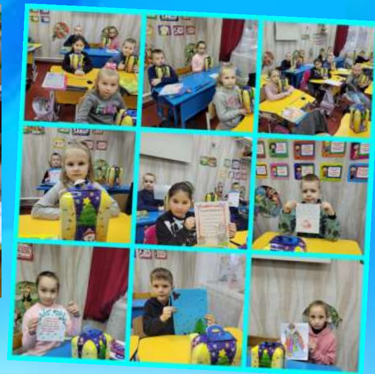
Листи з побажаннями