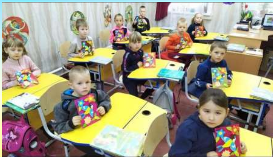
Урок «Дизайн і технології». Виготовлення 3-Д листівок для матусь