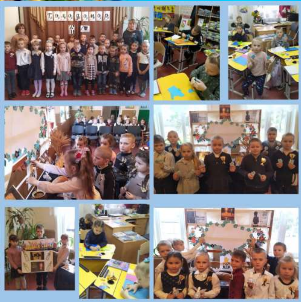
Година пам'яті "Не дамо загасити свічку!"