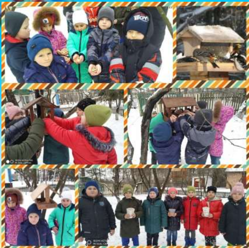
Заняття "Допомога братам нашим меншим"