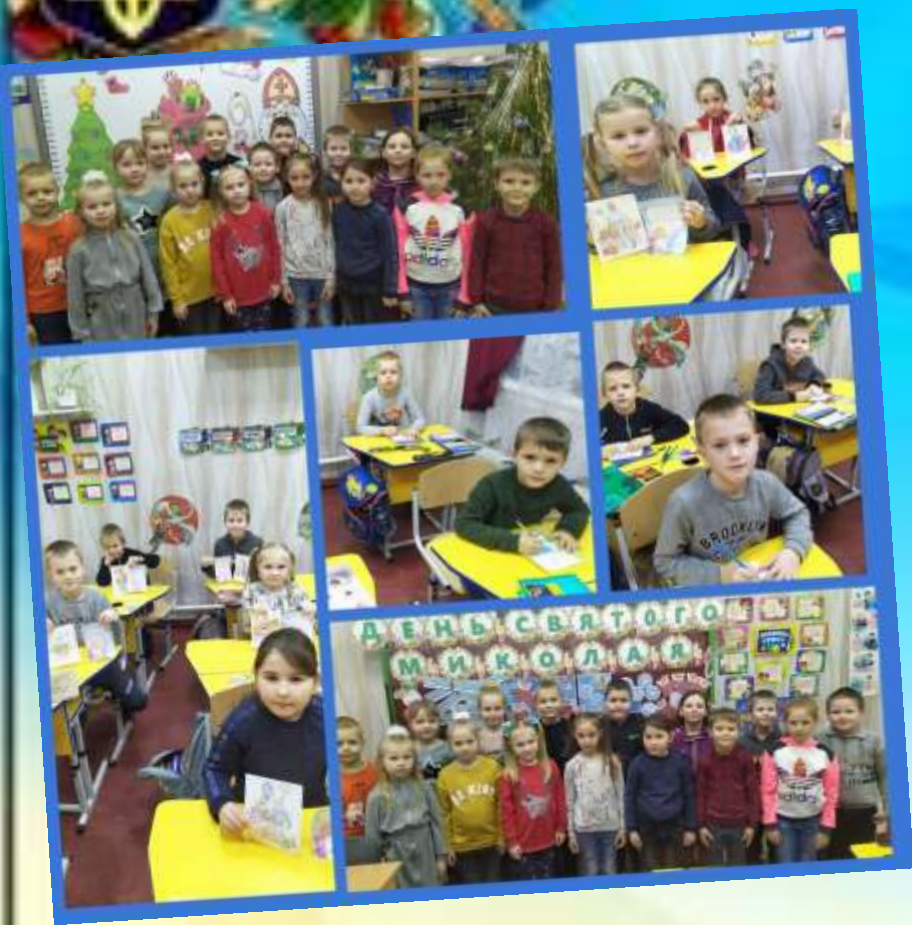
Виховна година "Йде Святий Миколай, ти добром його стрічай!"