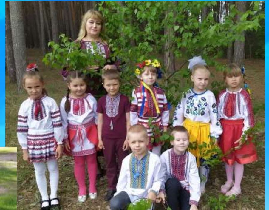
Флешмоб "Зроби фото у вишиванці"