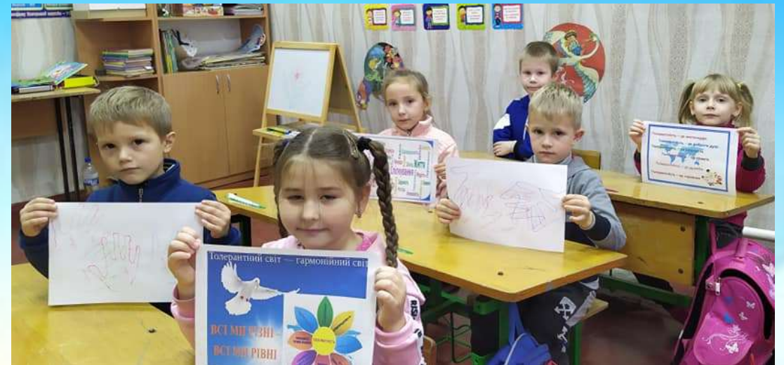
Урок-подорож Країною Толерантності "Сонце всім однаково сяє"