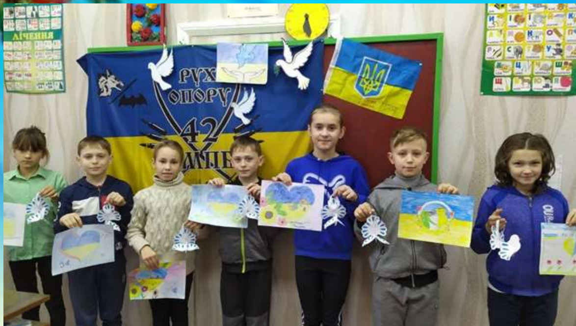
Інтегрований урок «Голуб миру» (виготовили символи миру і добра для воїнів)