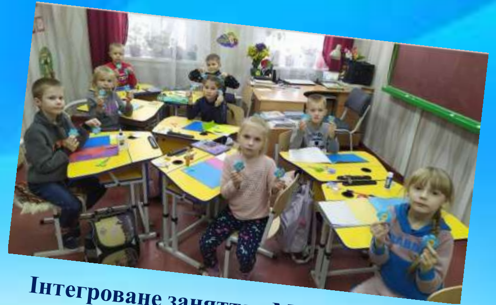
Інтегроване заняття «Мамина казка»