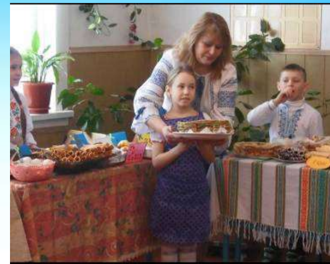
"Ярмарка смаколиків" на підтримку воїнів АТО