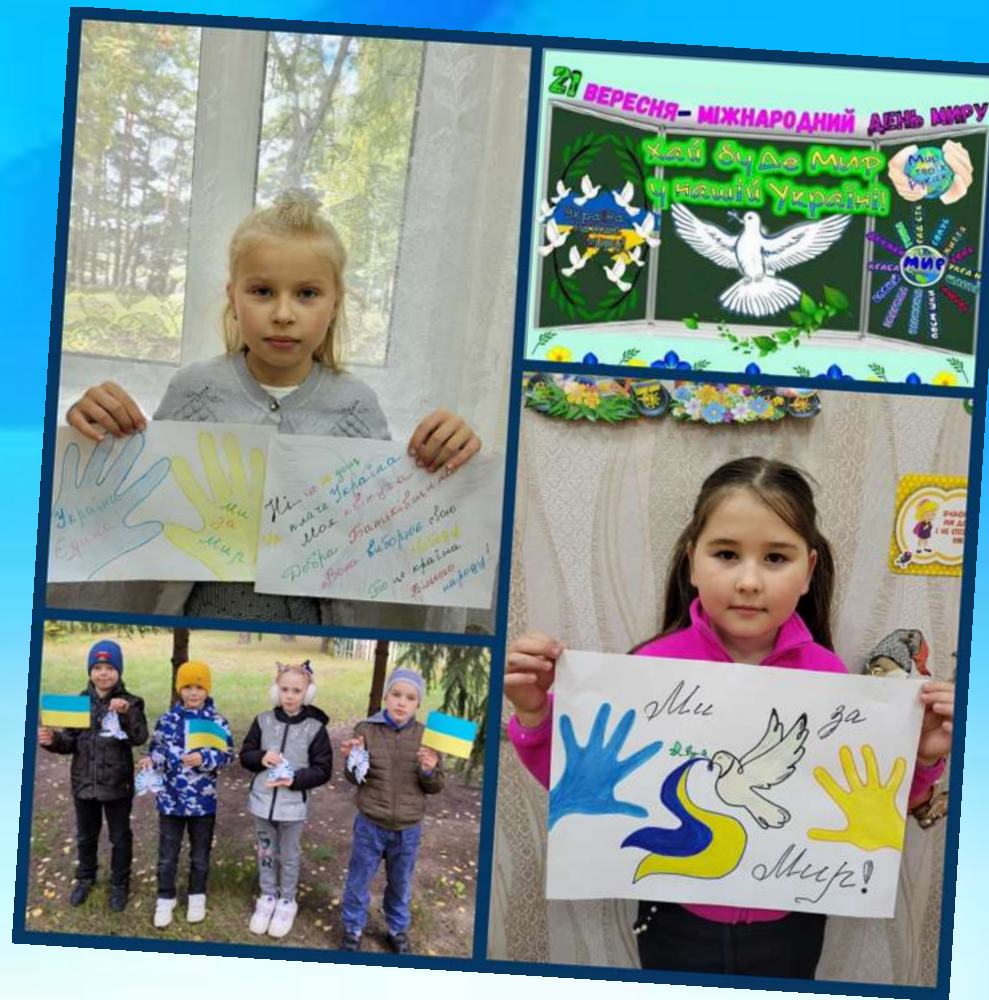
Тематичний урок у форматі онлайн "Хай буде мир у нашій Україні!"