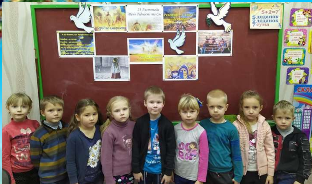
Урок мужності "Революція гідності : ціна свободи"