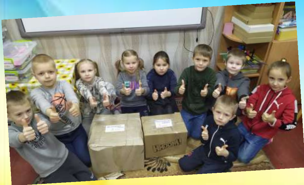
Гуманітарна допомога захисникам