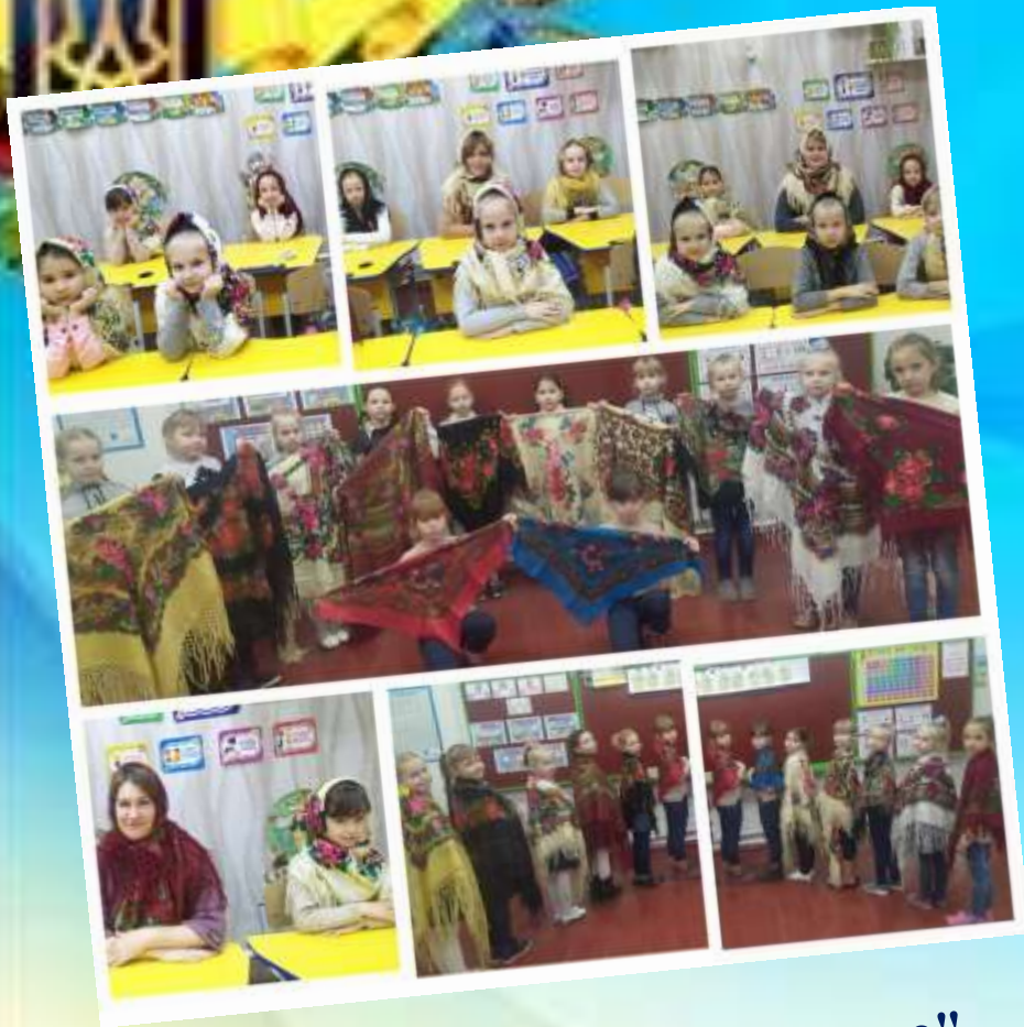
Флешмоб "Зроби фото з хусткою"