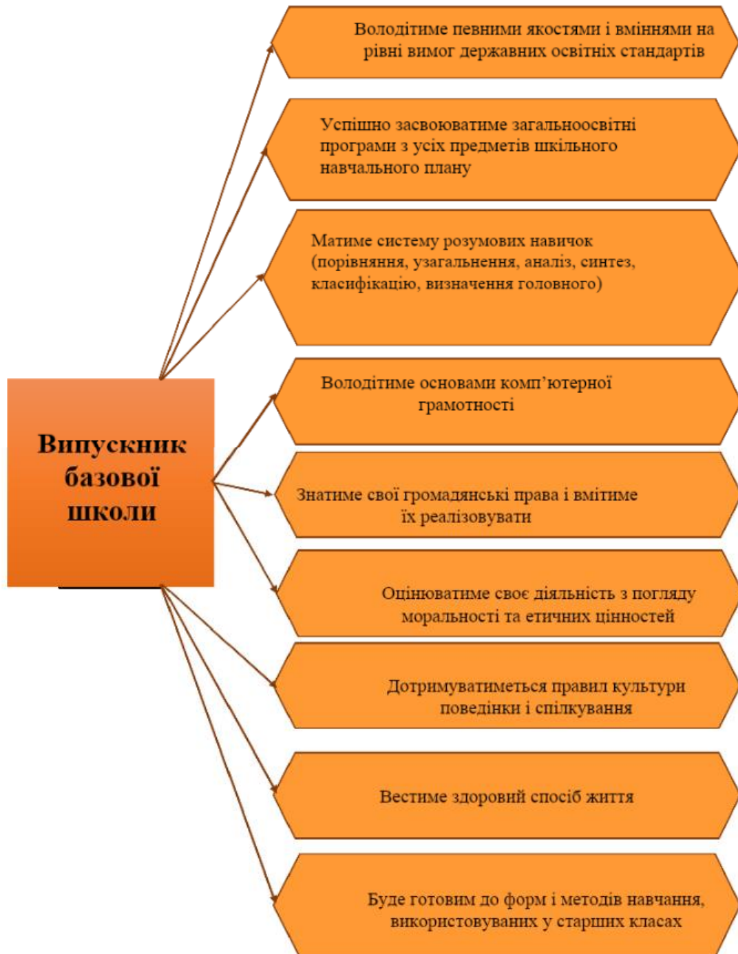
Модель випускника базової школи