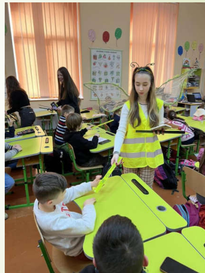
Акція «Світлячку, сяй»