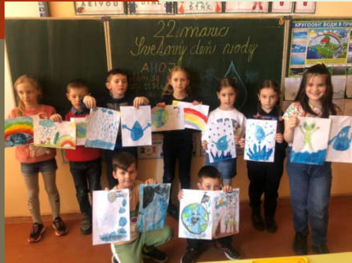
Всесвітній День води