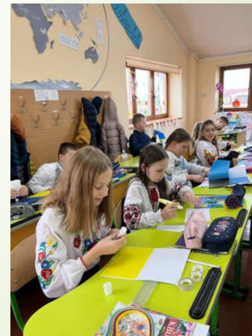
Міжнародний День рідної мови