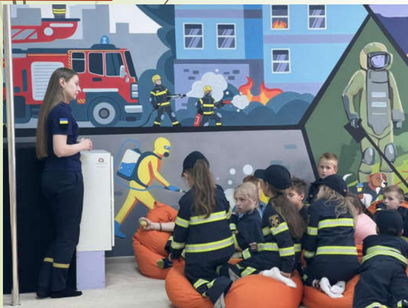
Заняття в класі «Вогник»