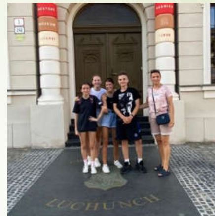
Літні оздоровчі табори