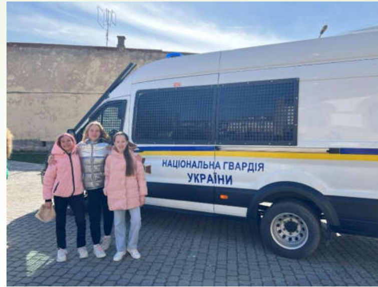
Відкритий урок Нацгвардії