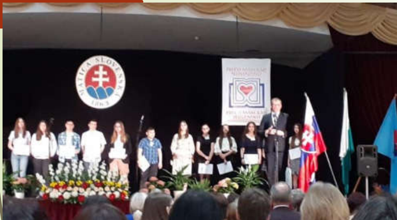
Сут'аž «Prečo mám rád slovenčinu, prečo mám rád Slovensko»