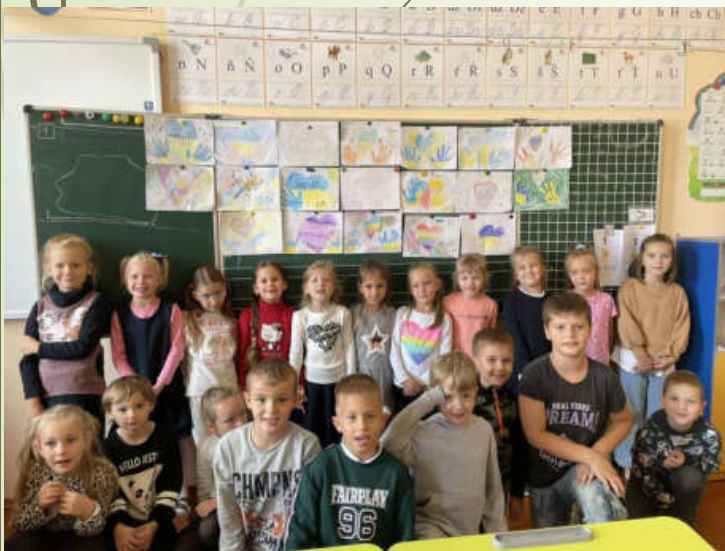
До Міжнародного Дня миру