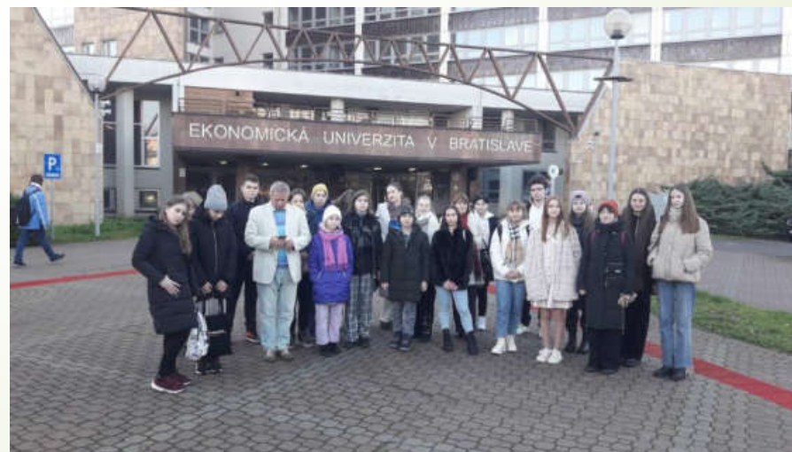
Осіння школа журналістики