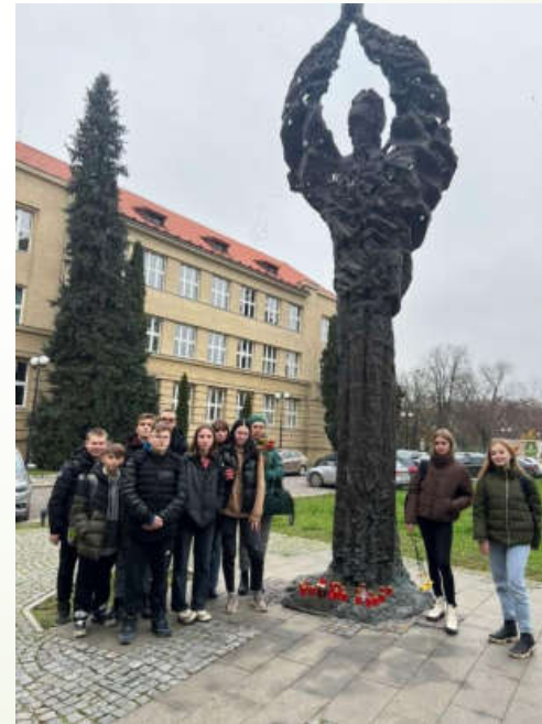
До річниці Голодомору