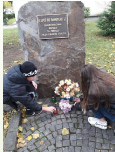
Героям Небесної Сотні