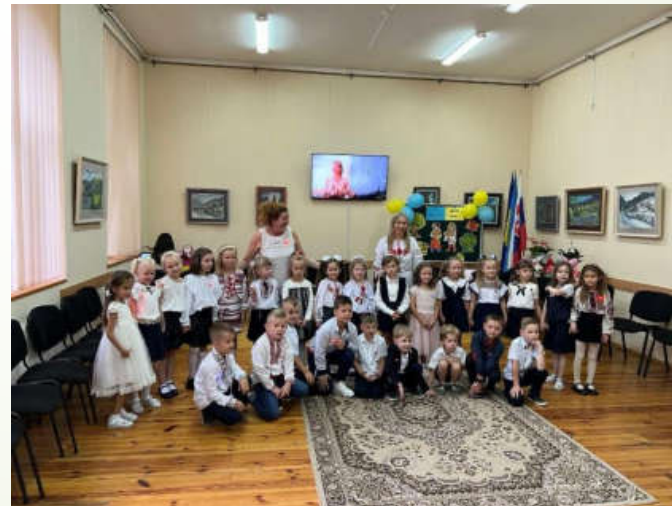
Свято Першого дзвоника