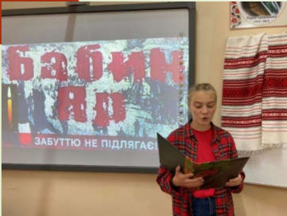
До роковин трагедії у Бабиному Ярі