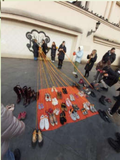
Акція «16 днів проти насильства»