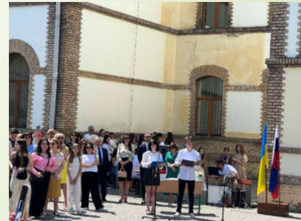
Свято Останнього дзвоника