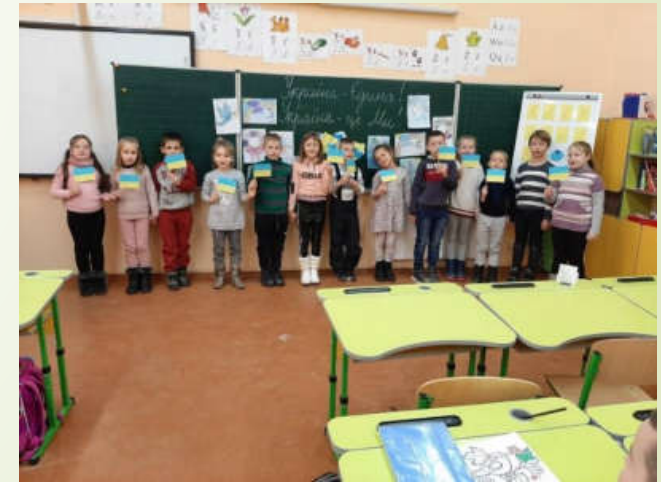
До Дня Соборності