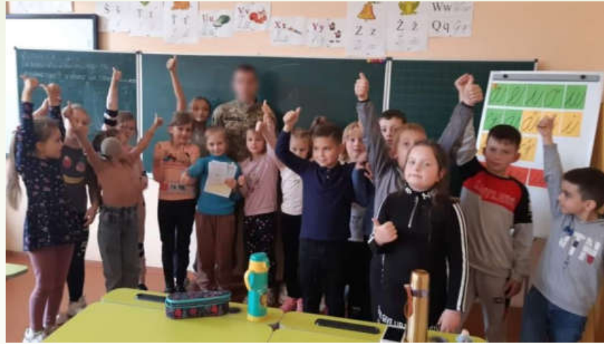
Відзначення Дня захисника