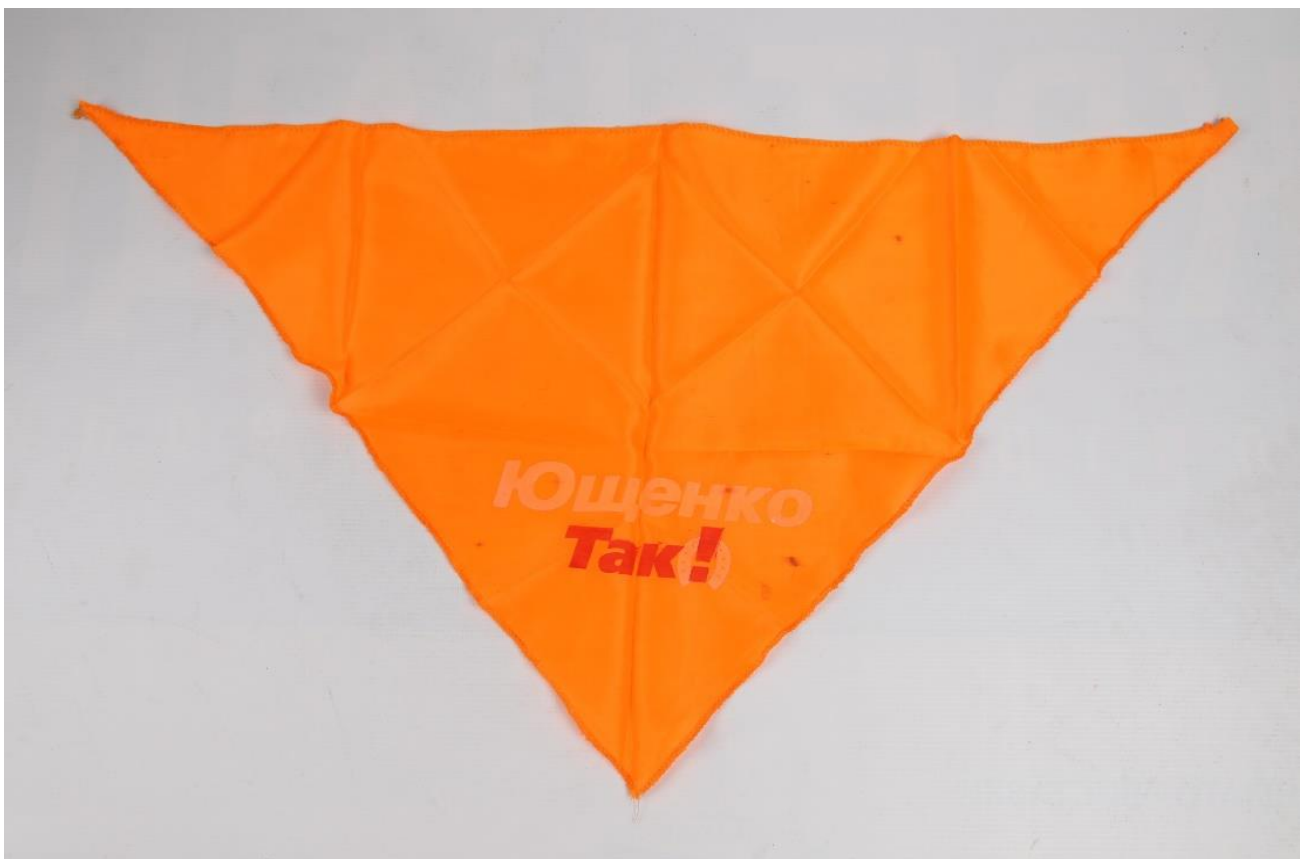
Хустина учасника Помаранчевої революції. Із фондів НМРГ

Окрім стрічок, з інших атрибутів помаранчевого Майдану використовували помаранчеві прапори з логотипом партії «Наша Україна» у вигляді підкови зі знаком оклику й написом «Так», наліпки, плакати, а також елементи одягу помаранчевого кольору: накидки (дощовики), хустки, шарфи тощо.