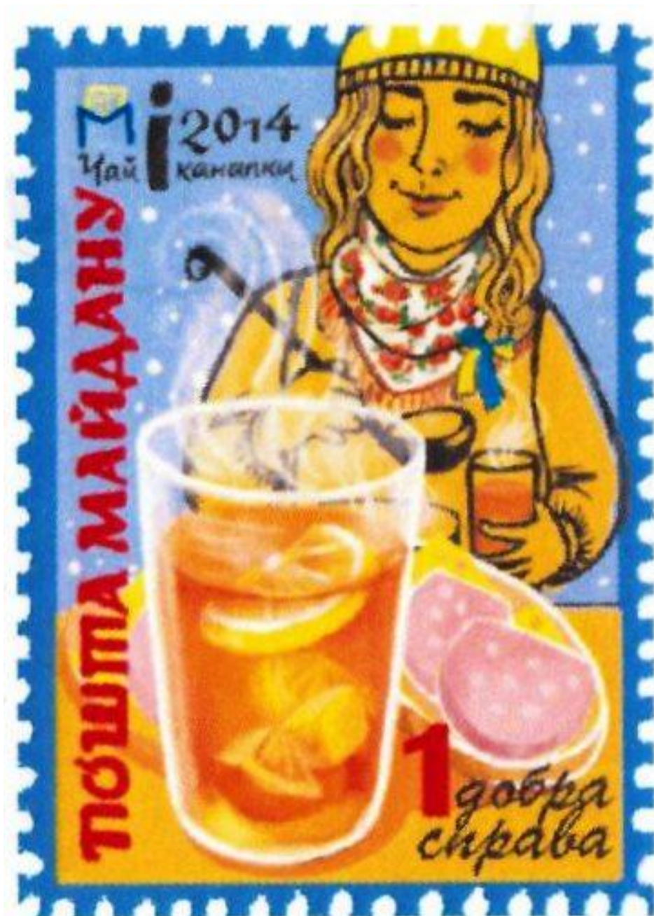
Марка «Пошти Майдану». Художниця Юлія Овчаренко. Із фондів НМРГ