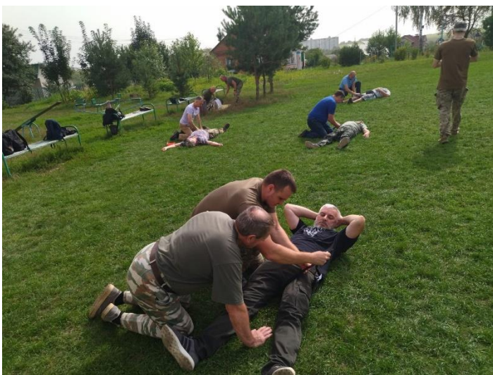
Вчителі предмету «Захист України» на занятті з тактичної медицини

Навчальний предмет «Захист України» в умовах сьогодення набуває нового значення та орієнтирів. Особливо актуальною є підготовка учнівської молоді до захисту життя та здоров'я, забезпечення власної безпеки та безпеки інших людей в надзвичайних умовах воєнного часу, виконання військового обов'язку. Для цього педагоги насамперед навчаються самі, відвідуючи семінари та практичні заняття з цивільного захисту, тактичної медицини, знайомляться з новітніми вправами володіння зброєю.