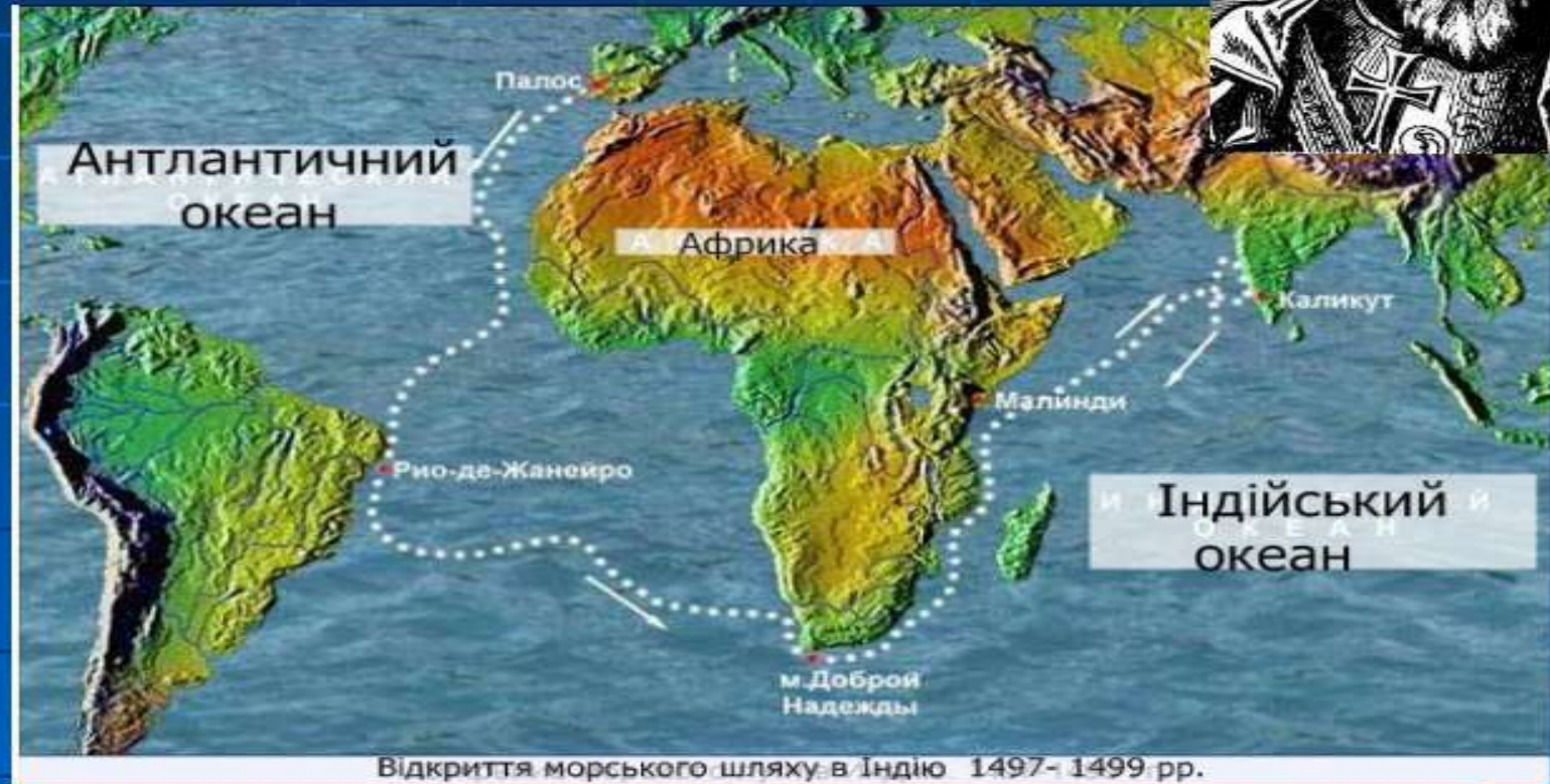
Відкриття морського шляху в Індію 1497-1499 рр.