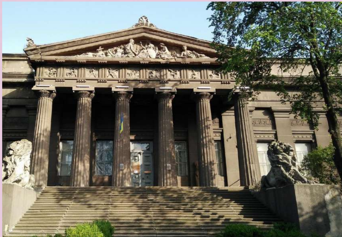
Національний художній музей України

❖ У 2008 музейна мережа України налічувала 478 державних музеїв.