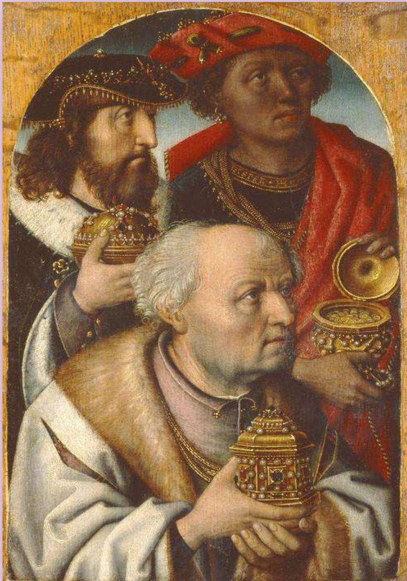
Поклоніння волхвів. Диптих, автор невідомий