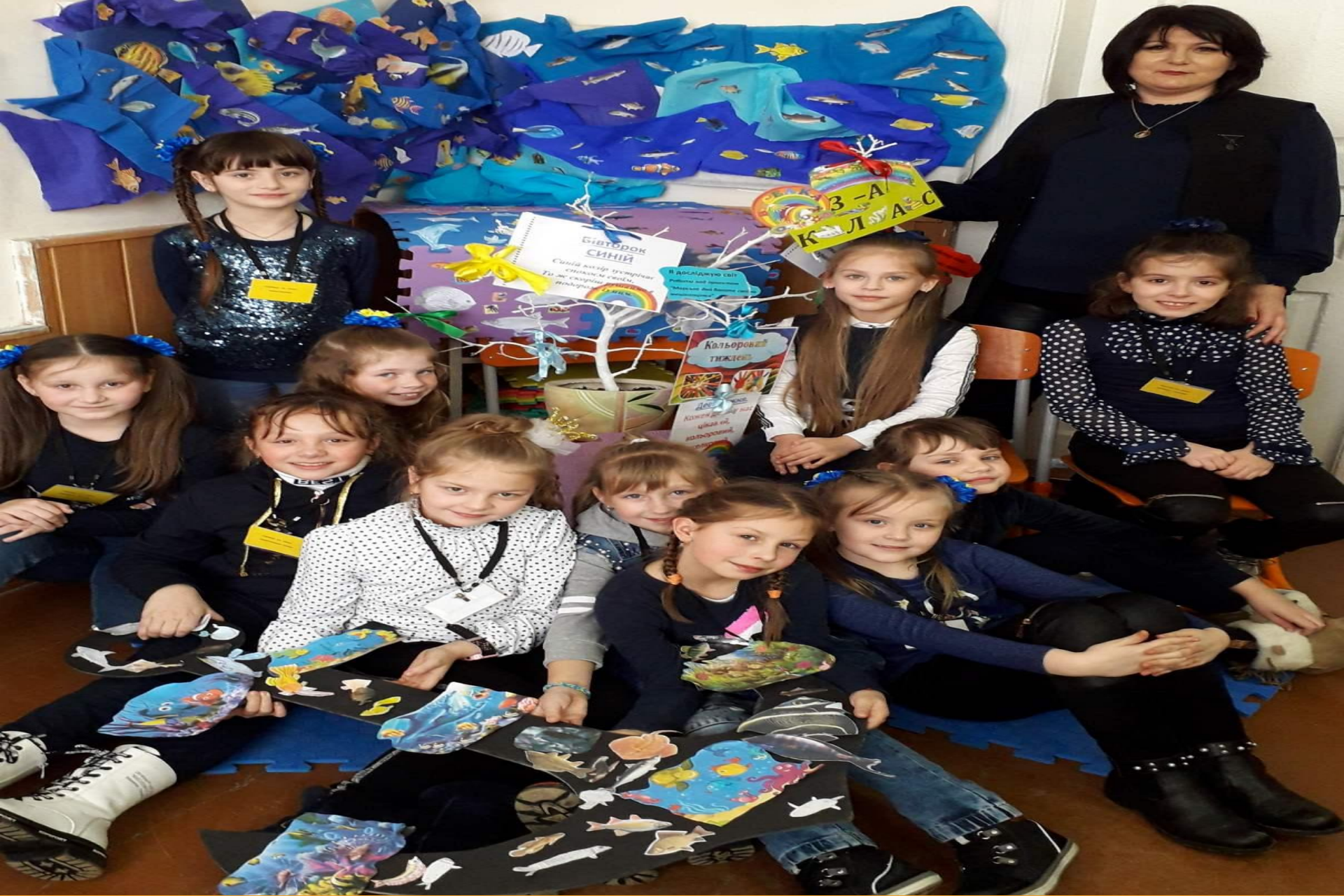
ПРОЕКТ "МОРСЬКЕ ДНО ВРАЖАЄ СВОЇМИ МЕШКАНЦЯМИ"