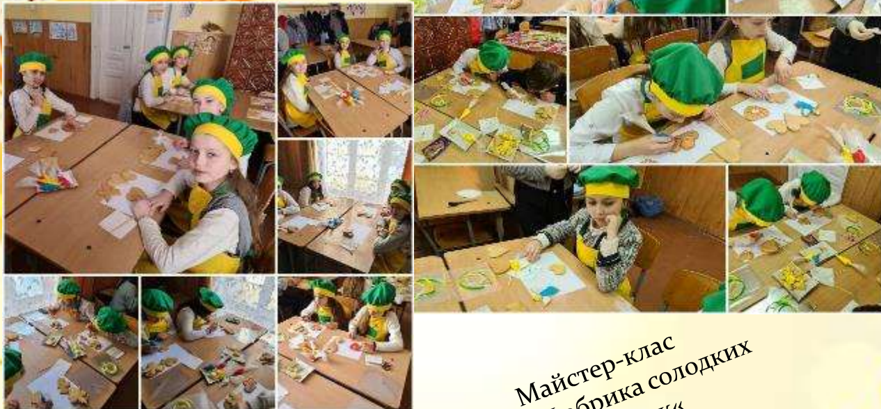
Майстер-клас « Фабрика солодких валентинок» 5 -Б клас 2021 рік