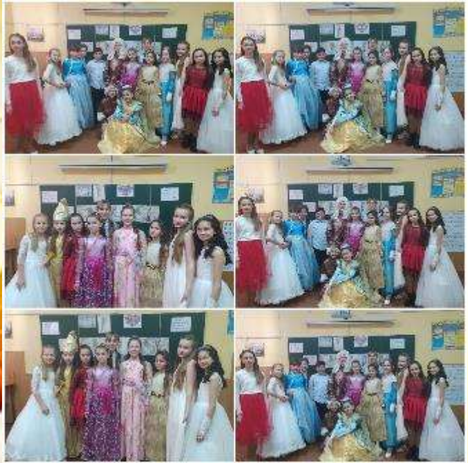
Інсценізація казки «Попелюшка» англійською мовою 5 – Б клас