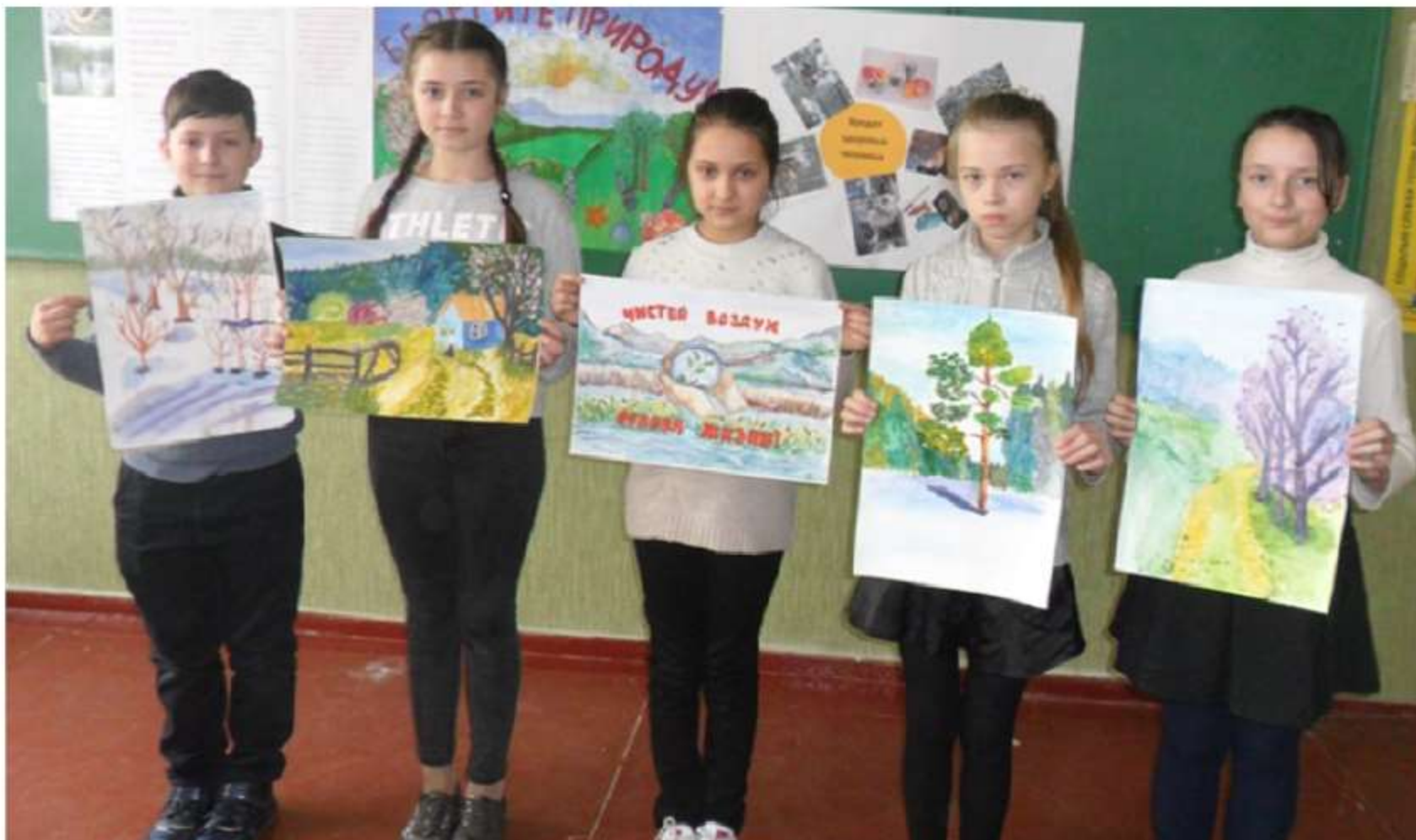
Учні 5-А класу