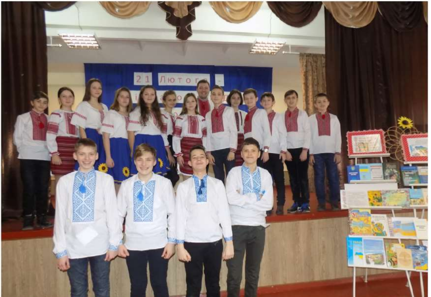
Учні 7-А класу: «День рідної мови»