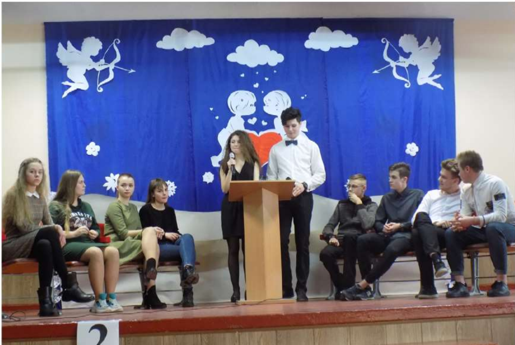
Одна з творчих робіт дівчат: оформлення сцени «До дня святого Валентина»