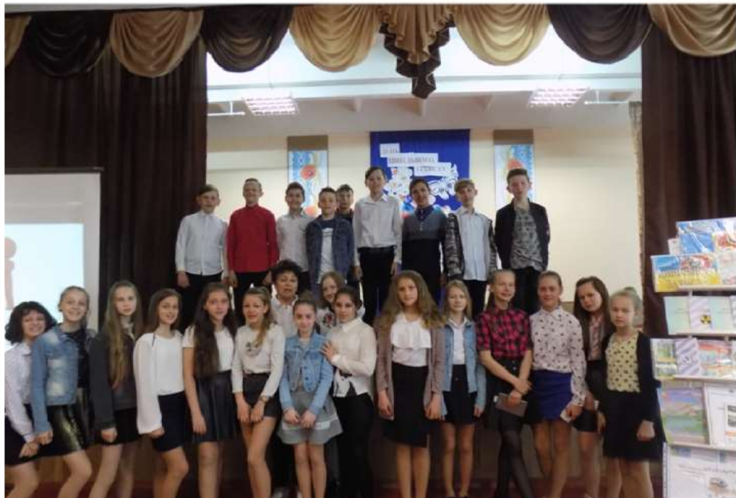
Учні 6-Б класу : «Чорнобиль»