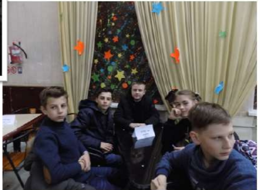
Команда учнів 8-А класу