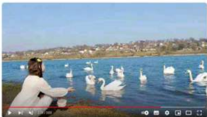
Міжнародний конкурс «Квітка буття» - 2024. Відео-блог «Один день з життя природи» Полової Анни