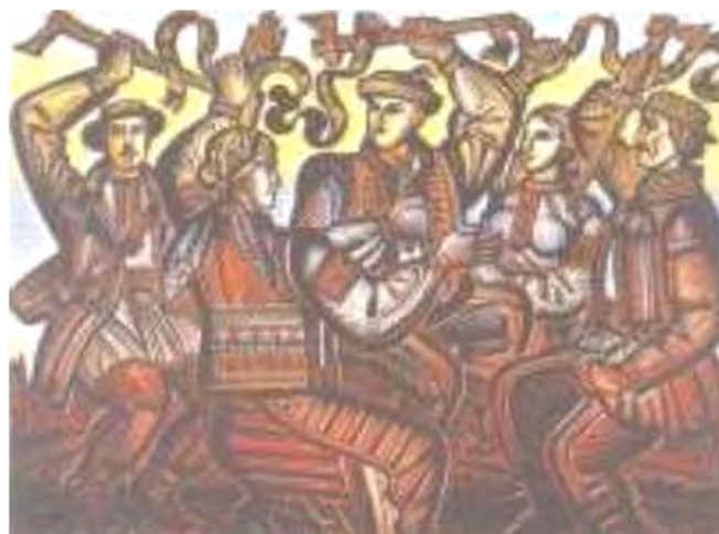
О. Губарев. Танок лісорубів. 1980-і роки

Ой заграю у сопілку, заграю, заграю, Вчує мене моя любка, що живе на плаю 1 .