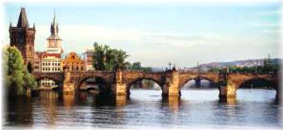
Карлів міст. м. Прага (Чехія)