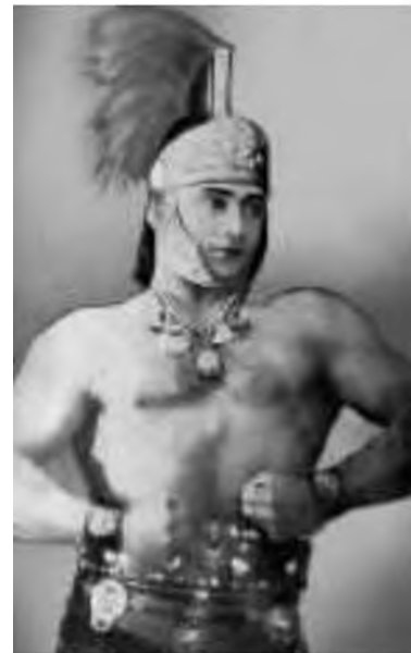
Іван Фірцак. Фото

Іван Фірцак народився в червні 1899 р. в українському селі Білках на Закарпатті. За неймовірну силу отримав прізвисько Кротон. Чемпіон Чехословаччини з важкої атлетики та боротьби. Чемпіон Європи з культуризму. Вісімнадцять років був артистом чехословацького цирку. Побував у шістдесят чотирьох країнах, дивуючи всіх неймовірною силою. Виграв чимало поєдинків із відомими борцями світу. Після програшу українському силачеві Кротону чемпіон Британії з боксу Джон Джексон викинувся з вікна. З рук королеви Англії Іван Фірцак отримав шолом і пояс, оздоблені золотом і діамантами. Американська преса називала його найсильнішою людиною ХХ ст. Після одного з боїв переніс важку операцію, під час якої йому замінили частину черепної кістки на золоту пластину. Але Кротон і далі продовжував свої знамениті виступи. На початку 1940-х років повернувся на Закарпаття з дружиною Руженою Зікл, повітряною гімнасткою «Герцферт-цирку». Подружжя мало восьмеро дітей. Старший син Іван став чемпіоном України з боксу в середній вазі. У 1948 р. він був засуджений за «український буржуазний націоналізм». У концтаборах відсидів вісім років. Це була одна з причин, чому за радянських часів ім'я Кротона не афішувалося. Знаменитий силач помер у 1970 р. в рідному селі Білках. У народі його прозивали Іваном Силою.