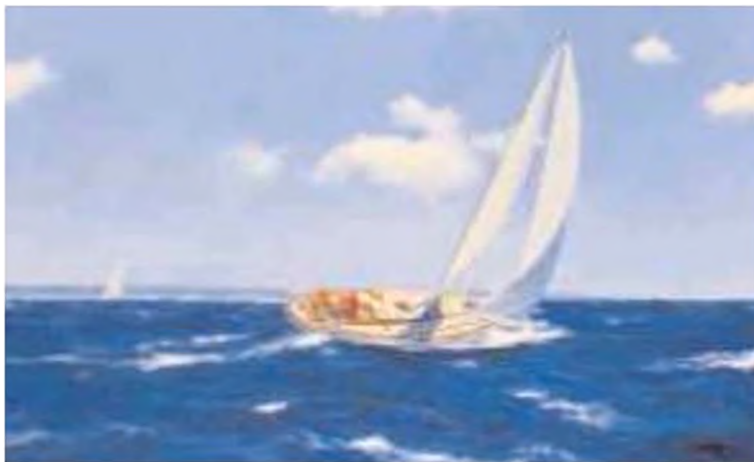
Дж. Бреретон. У морі. 2003 р.