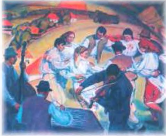
М. Романишин. Свято. 1969 р.

Ой Олена прибілена красно ся вбувала, Коровиці не доїла — хвоста ся бояла.