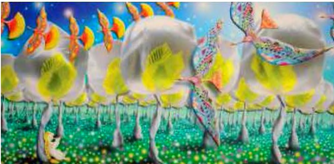
В. Ковальчук. Дитячі сни. 2011 р.

У кого — з вірності у коханні. У кого — з вічного поривання.