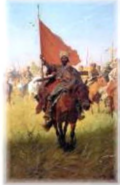
Ю. Брандт. Повернення переможців. XIX ст.

А позаду Сагайдачний, Що проміняв жінку На тютюн да люльку, Необачний! «Вернися, Сагайдачний, Візьми свою жінку, Одай мою люльку, Необачний!» «Мені з жінкою не возиться; А тютюн да люлька Козаку в дорозі Знадобиться! Гей, хто в лісі, озовися! Да викрешем огню, Да потягнем люльки, Не журися!»