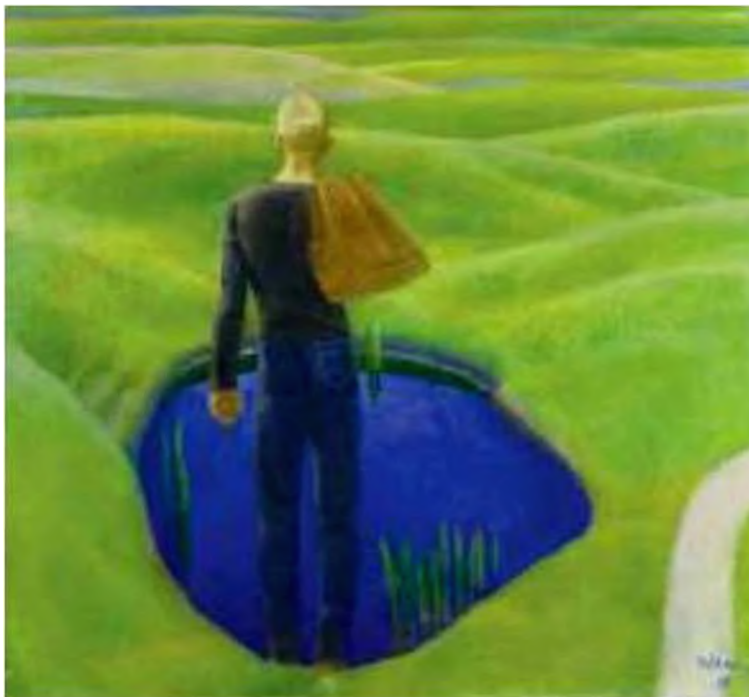
Т. Яблонська. Юність. 1969 р.

Бо ти на землі – людина, І хочеш того чи ні – Усмішка твоя – єдина, Мука твоя – єдина, Очі твої – одні.