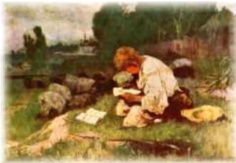
І. Іжакевич. Тарас-пастух. 1935 р.

І хлинули сльози, Тяжкі сльози!.. А дівчина При самій дорозі Недалеко коло мене Плоскінь вибирала, Та й почула, що я плачу. Прийшла, привітала, Утирала мої сльози І поцілувала... Неначе сонце засіяло, Неначе все на світі стало Моє... лани, гаї, сади!.. І ми, жартуючи, погнали Чужі ягнята до води. (...)