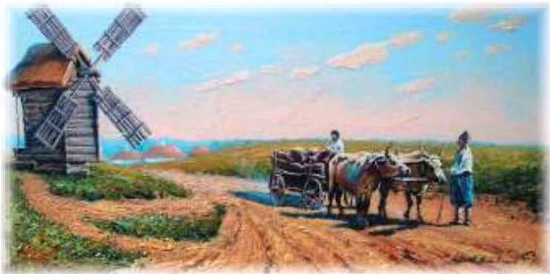
І. Айвазовський. Чумаки на відпочинку. 1885 р.

— Ой рад би я, моя мила, Хоч обидві подати: (2) Насипано та сирої землі, Що не можу підняти.