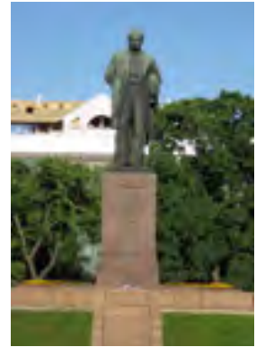
М. Манізер. Пам'ятник Т. Шевченку в Києві