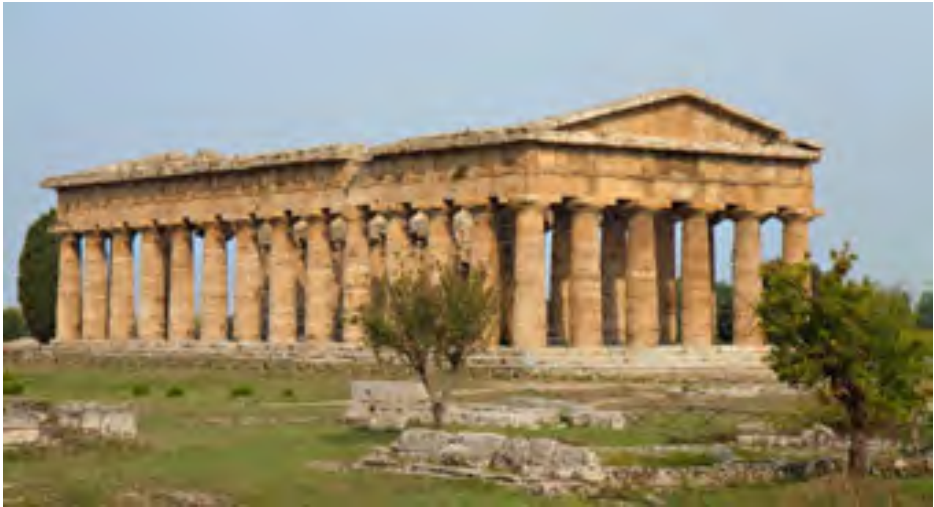
Храм богині Гери в Пестумі (V ст. до н. е.)

Архітектура ранніх грецьких храмів, до яких належать два храми богині Гери (серед. VI ст. до н. е. і серед. V ст. до н. е.) в Пестумі, вирізнялася масивністю, величною суворістю. Таке враження створювалось завдяки приземистим доричним колонам, розміщеним доволі близько одна від одної. Загальний вигляд цих монументальних споруд, строгі пропорції та чіткий ритм колонади підкреслювали велич міста-держави, непорушність суспільного порядку.