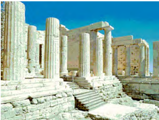
Пропілеї. Афінський Акрополь

Розгляньте ілюстрацію. Охарактеризуйте зображену архітектурну споруду за питаннями (с. 26).