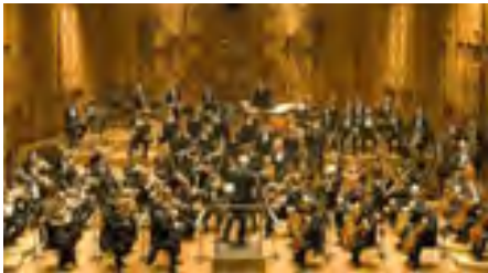
Лондонський симфонічний оркестр