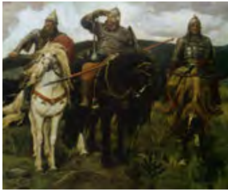
В. Васнецов. «Три богатирі»