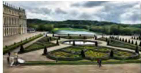
Версальський парк. Франція

Предметами зображення в мистецтві є природні об'єкти, внутрішній світ людини, її почуття, важливі для неї події особистого чи суспільного життя, побут, традиції тощо, а специфічною формою відображення дійсності — художній образ , який виявляє загальне через конкретне, індивідуальне. Тобто, митець творчо переосмислює дійсність і, використовуючи художню мову, способи зображення та засоби виразності того чи іншого виду мистецтва, передає свої думки, враження й переживання в художньому творі.