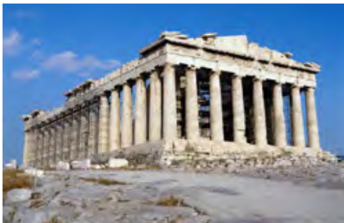
Парфенон — храм Афіни Парфенос

Храм Ерехтейон (кін. V ст. до н. е.) — унікальна пам'ятка античної архітектури завдяки асиметричності планування та знаменитим каріатидам — мармуровим статуям дівчат, що виконують роль колон. Східна частина цієї будівлі, спорудженої в іонічному стилі, була присвячена богині Афіні, а західна — Посейдону й афінському царю Ерехтею, на честь якого храм і отримав свою назву.