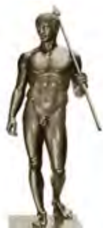
Доріфор. Римська копія

Юнак непорушно стоїть перед глядачем, проте його поза суттєво відрізняється від пози архаїчних куросів. Списоносець ледь зігнув одну ногу і переніс масу тіла на іншу. Завдяки цьому створюється враження, що він за мить зробить крок і зійде з постаменту. Оригінал статуї був відлитий із бронзи, але до нас дійшли тільки мармурові копії, виготовлені римлянами.