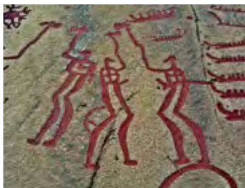
Ритуальний танок. Наскельний малюнок епохи бронзи. Швеція

Окрім цього, стародавні люди знаходили час для ритуальних співів і танців, основу яких складали рухи, що імітували поведінку тварин, мисливські та військові вправи. Подібні заняття для наших предків були водночас і магічним обрядом, і актом пізнання, і засобом передачі досвіду та згуртування колективу.