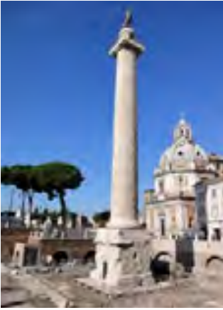
Колона Траяна. Рим

ма поздовжніми рядами колон. Традицію будівництва форумів кожним новим імператором (форум Августа, форум Траяна) започаткував Юлій Цезар. Важливим елементом цієї частини міста були меморіальні споруди, які прославляли перемоги римської зброї, видатних полководців та імператорів — триумфальні арки й колони. Серед них — знамениті на весь світ колона Траяна і Триумфальна арка Тита в Римі.