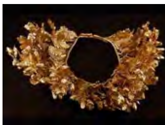
Лаєровий вінок, золото