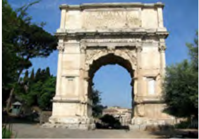
Триумфальна арка Тита. Рим

Культові будівлі Стародавнього Риму, на відміну від грецьких, були прикрашені колонадами тільки з фронтальної сторони. Давньоримські зодчі запозичили в інших народів, удосконалили й широко використовували арокні конструкції, склепіння і куполи. Часто будували круглі в плані храми — ротонди (від лат. rotundus — круглий ).