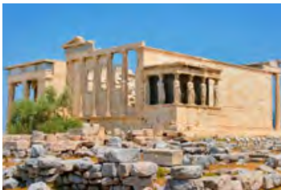
Храм Ерехтейон. Афіни

Храм Ніки Аптерос (Безкрилої) , збудований зодчим Каллікратом наприкінці V ст. до н. е., належить до іонічного ордера. Це найменша за розмірами споруда Афінського Акрополя. Витонченість ліній, легкість і пропорційність форм створюють відчуття польоту. Храм дуже постраждав від воєнних дій у різні епохи. Лише в 2000 р., використовуючи всі знайдені фрагменти, його вдалося ретельно відреставрувати.