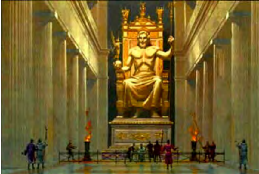
Зевс Олімпійський. Малюнок

Статую Зевса Олімпійського вважали одним із семи чудес світу. Вона була встановлена у храмі Зевса в місті Олімпія на півострові Пелопоннес. Статуя простояла майже 900 років і загинула під час пожежі в V ст. Однак численні описи в творах стародавніх істориків, письменників і мандрівників, археологічні знахідки (зменшені копії, зображення на монетах) дають нам уявлення про цей величний твір Фідія.