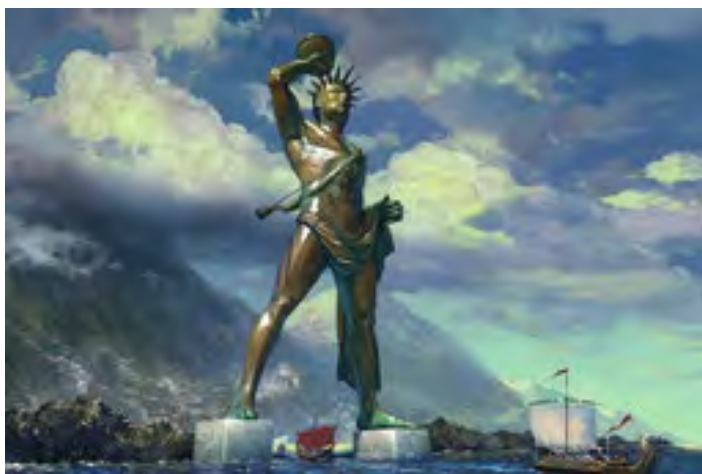
Колос Родоський. Малюнок

Гігантська 32-метрова статуя бога Геліоса — найяскравіший зразок монументальної скульптури епохи еллінізму. Цей витвір інженерного мистецтва, споруджений між 292 та 280 роками до н. е. на вході у гавань острова Родос, увійшов до переліку семи чудес світу під назвою « Колос Родоський ».