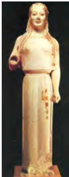
Курос і кора. VI ст. до н. е.

Протягом наступних століть майстри намагалися передати у скульптурі гнучкість і рухливість людського тіла, красу пропорцій та одухотвореність обличчя.