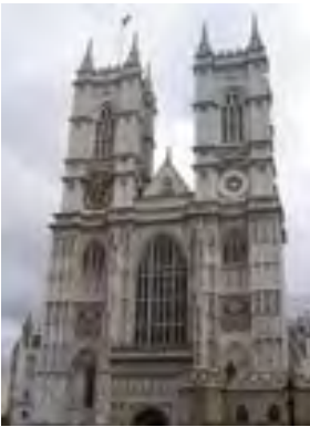
Вестмінстерське абатство. Лондон

Розгляньте ілюстрації. Які види мистецтва на них зображено? Обґрунтуйте свою думку.