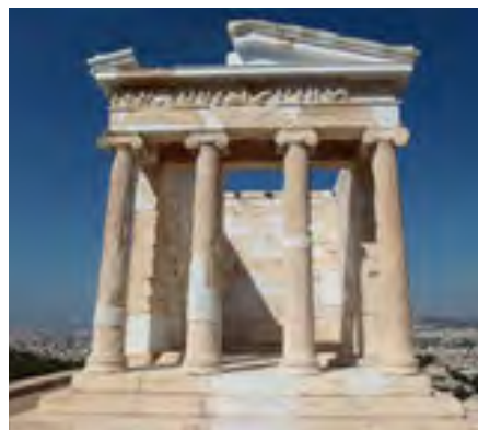
Храм Ніки Аптерос. Афіни