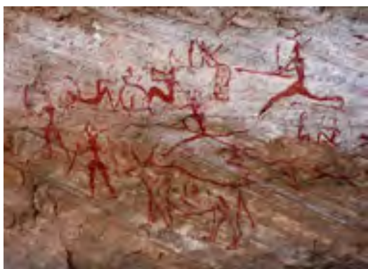
Наскельний малюнок у печері Шові. Франція

Мистецтво як особливий вид людської діяльності зародилося ще в добу палеоліту. Наші печерні предки, незважаючи на щоденну сувору боротьбу за виживання, захоплювалися красою довкілля, багатством та різноманітністю природних форм і намагалися відтворити їх у рисунках доступними засобами. Давні художники використовували гострі камінці для продряпування на скелях або вуглинка від вогнища, природні мінеральні фарби для контурних чи силуетних зображень тварин на стінах печер. Фарбу наносили пальцями або примітивними пензлями (жмут вовни, пучок трави). Пізніше в наскельних малюнках почали з'являтися зображення людей, сюжетні композиції — зокрема, сцени полювання. Із глибини віків до нас дійшли й висічені з каменю скульптури тварин, рельєфи, гравюри на кістках і рогах упольованих звірів.