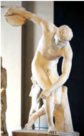
Дискобол. Римська копія, мрамур

Статуя «Дискобол» — перша класична скульптура, що зображує людину в русі.