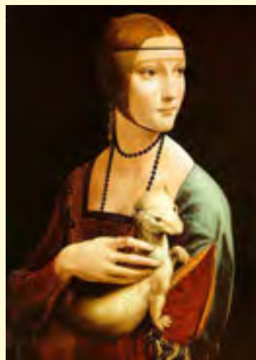
Леонардо да Вінчі. «Пані з горностаєм»

Загалом, робота викликає піднесені почуття. Ніжний овал обличчя, проникливий погляд великих, красивих очей, ледь помітна усмішка в куточках вуст — усе це підкреслює не лише зовнішню привабливість, а й красу душі юної моделі.