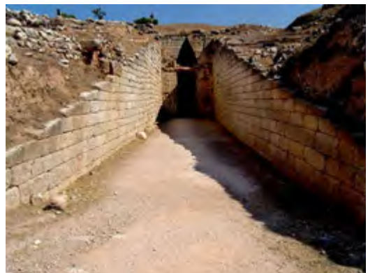
Руїни палацу, м. Кносс