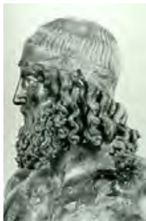
Скульптура доби грецької класики