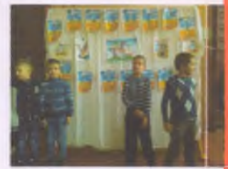
Хто такі козаки?