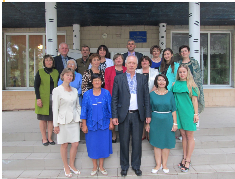
На фото: ось така наша вчительська сім'я

У 2018-2019 навчальному році в Мар'янівській загальноосвітній школі I-III ступенів працює 20 учителів. Серед них 6 мають вищу кваліфікаційну категорію, 7—першу, 1— другу та 6 молодих учителів мають кваліфікаційну категорію «спеціаліст».