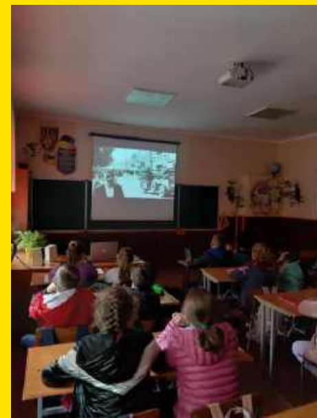
День пам'яті жертв Бабиного Яру