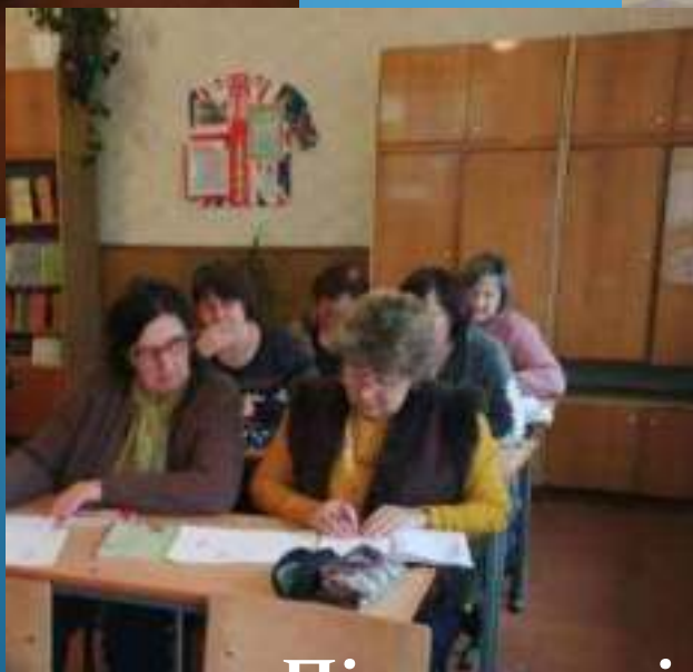
Під час засідання педагогічної ради