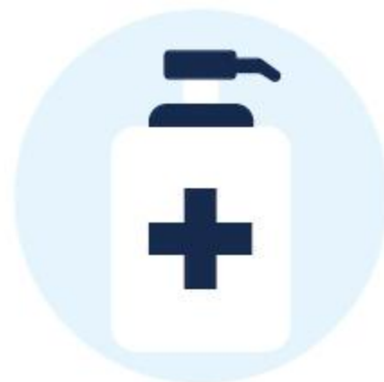
Дозатори для антисептиків