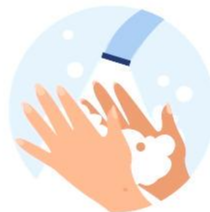
Миття рук з милом перед уроками

Керівник та засновник закладу освіти відповідає за те, щоб у медичному пункті були необхідні засоби та обладнання: безконтактні термометри, дезінфектори, антисептики для рук, засоби особистої гігієни та індивідуального захисту.