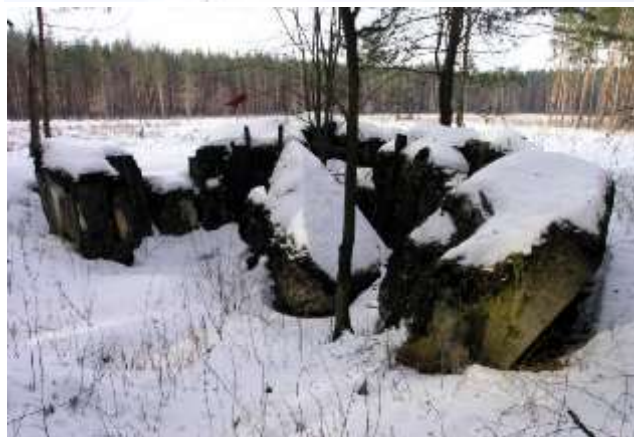
ДОТ № 582. Кулеметний, тип – М2, одноповерховий, на 3 амбразури.

Комендант: л-т Новаковський І.Я. Фото 2007 року