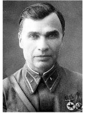
Кирпонос Михайло Петрович

За цей час вентиляційні системи і водяні трубопроводи заржавіли і піддалися корозії, деякі доти частково були затоплені дощовими водами. Дерев'яні елементи в дотах сильно прогнили,