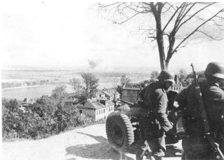
Захоплення Києва Вермахтом. Німецька гармата Рак 35/36 на вогневій позиції в Києві, на крутому березі Дніпра

Вдень 131-й п.п. німців через с. Воронківка вийшов до Демидова, де стояли частини Червоної армії та поодинокі танки, і до ранку 25 серпня захопили село Демидів, взявши в полон 30 червоноармійців, а двох полонених партизан розстріляли. Інші німецькі війська зупинились на лінії Озера-Блиставиця. До вечора 25 серпня німці зайняли Ірпінь і Бучу. Радянські війська свідомо і організовано відійшли на правий берег річки Ірпінь на лінію укріпрайону.