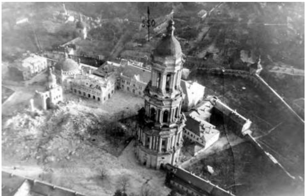
Соборна площа Києво-Печерської Лаври з руїнами Успенського собору. Знято з борту німецького літака, 1941р.

...Коли почався масований обстріл, командир дота, лейтенант зі своїми бійцями залишив дот і втік на півтора кілометра в тил. Командир 28 дивізії зі своїми людьми, підійшовши до цього місця, зайняв залишений дот, а коли закінчився ураганний вогонь і німців відбили, цей лейтенант зі своїми