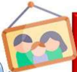
Фото з батьками. На світлині має бути написані телефони родичів, повна адреса, ПІБ дитини та її група крові