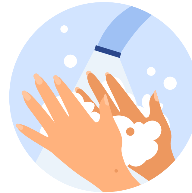
Миття рук з милом перед уроками

Керівник та засновник закладу освіти відповідає за те, щоб у медичному пункті були необхідні засоби та обладнання: безконтактні термометри, дезінфектори, антисептики для рук, засоби особистої гігієни та індивідуального захисту.