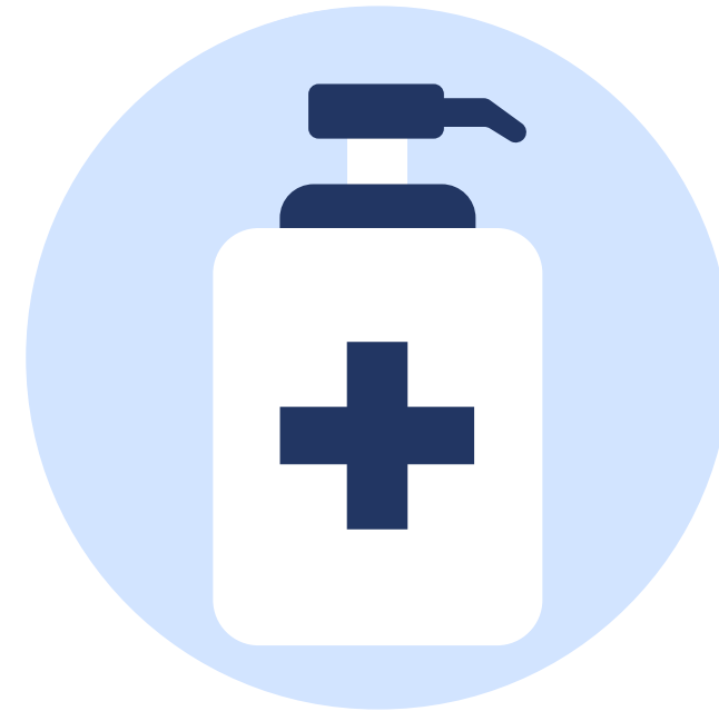
Дозатори для антисептиків