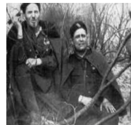
Загін С. Ковпака