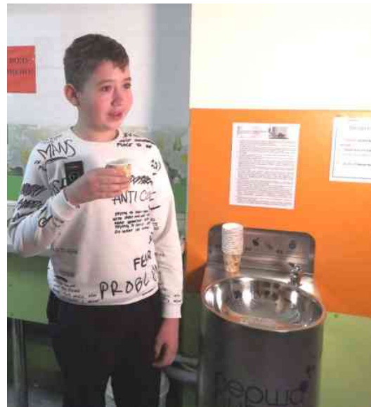
Питний фонтанчик з сучасною системою фільтрації