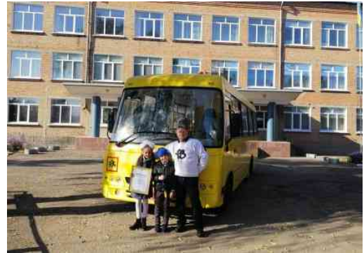
Новий шкільний автобус