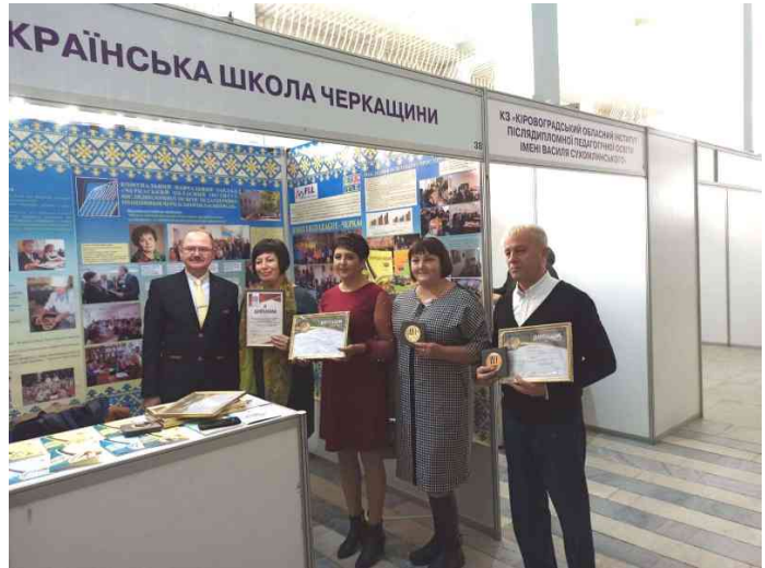
Золота нагорода на Міжнародній виставці «Інноватика в сучасній освіті»