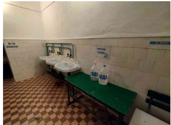
Укриття та генератор