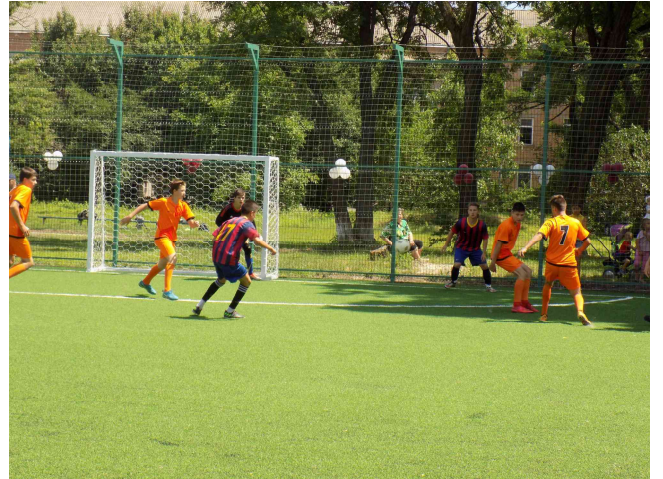
Міні-футбольне поле зі штучним покриттям