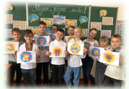
Урок української мови у 4-Б класі