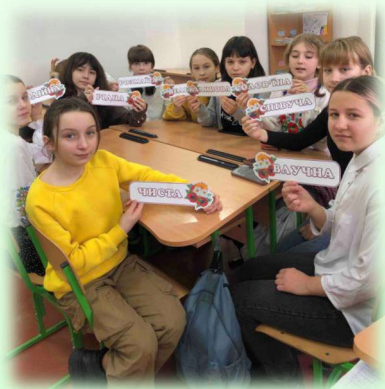
Мовознавчий квест «Ерудит» 5-