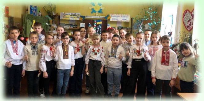
4-Б завітав до дитячої бібліотеки.