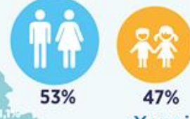
ВІКОВИЙ РОЗПОДІЛ ДЗВІНКІВ