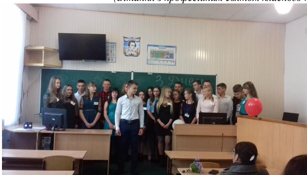
(Нарада учнів 11 класу для вчителів закладу)