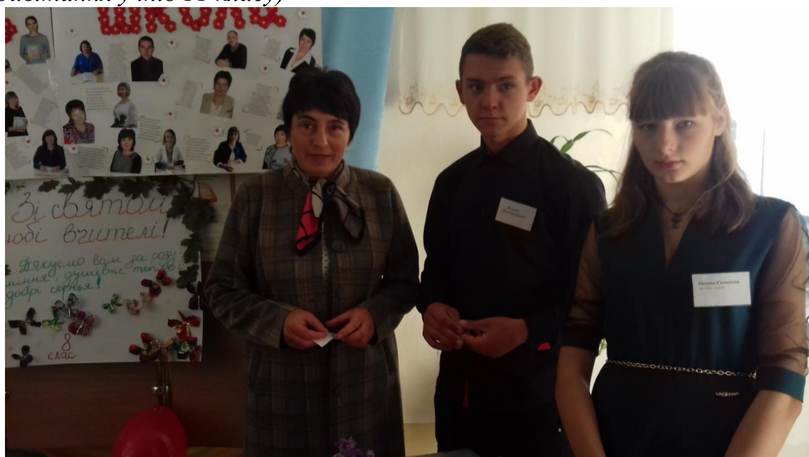
(Вітання з професійним святом класного керівника)