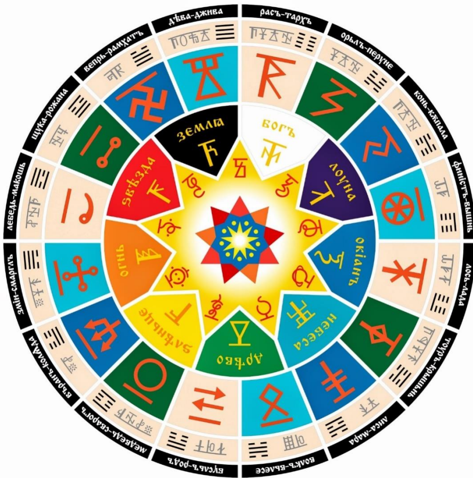
Мал.1. Коло Сварога

А Сварог таки спік Першу Хлібину — запашну й золоту як Сонце — і виніс її людям, і дав кожному по скибці, і вкусили люди тес диво, і силу відчули в собі неймовірну, і збагнули, що приніс Гость-Сварог їм велике щастя, і міць, і здоров'я, і довголіття. І врочисто стали на коліна перед ним — новим богом своїм — СВАРОГОМ .