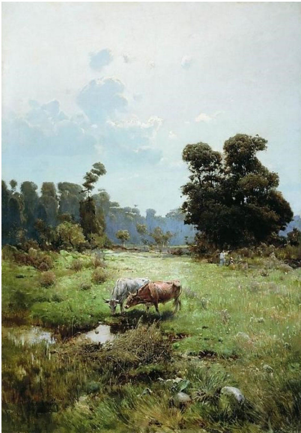
Картина С. Васильківського «Козача левада».