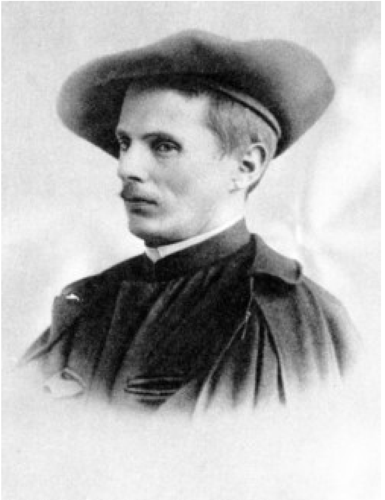
Сергій Іванович Васильківський