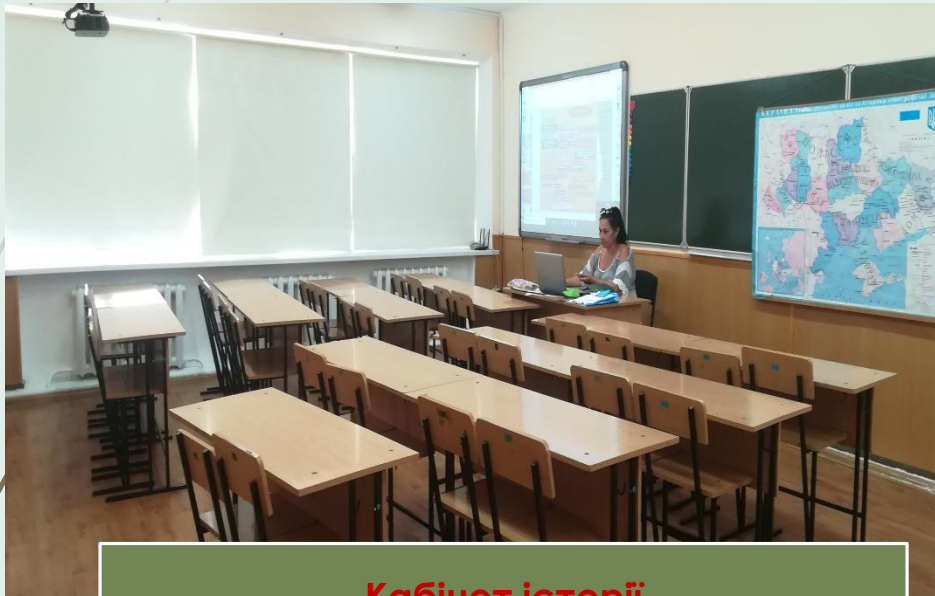
Кабінет історії 1 комп'ютер 1 мультимедійний комплекс