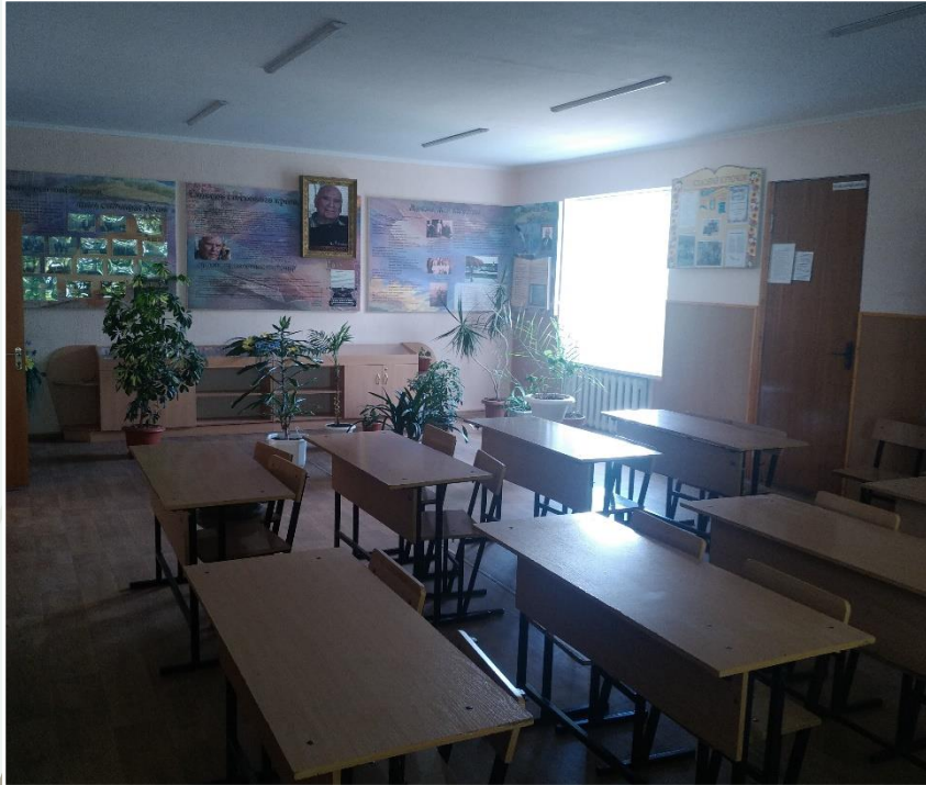
Кабінет №11 української мови та літератури 1 комп'ютер 1 телевізор