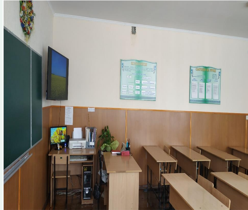
Кабінет №12 української мови та літератури 1 комп'ютер 1 принтер 1 телевізор