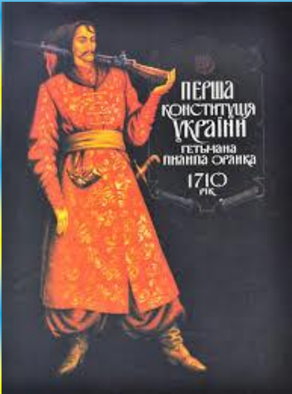
«КОНСТИТУЦІЯ ПИЛИПА ОРЛИКА»

Сьогодні дослідники наголошують, що не всі норми права у «Руській правді» Ярослава були справедливими. Точаться суперечки і про авторство. Одні вважають, що писали закони кілька людей, і Ярослав Мудрий не має до цього відношення, інші кажуть, що «Руська правда» є аналогом збірника законів зі Скандинавії. Але, безперечно – це перша і найстарша наша конституція.