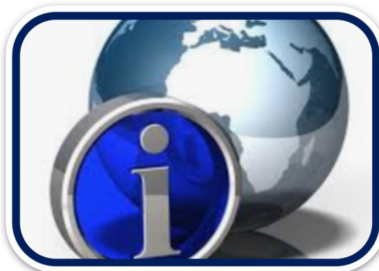
ВЕКТОР РОЗВИТКУ "ІНФОРМАЦІЙНЕ ЗАБЕЗПЕЧЕННЯ"