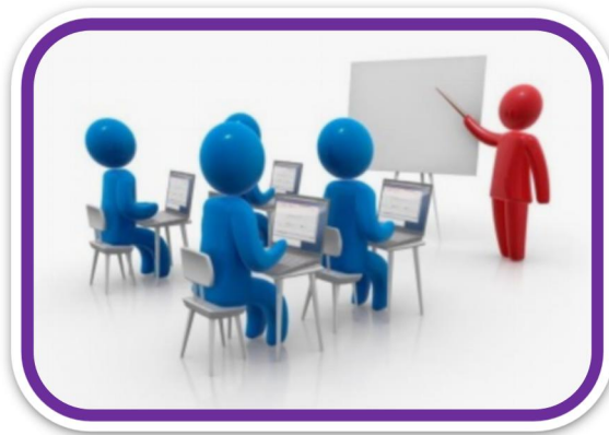
ВЕКТОР РОЗВИТКУ "КАДРОВЕ ЗАБЕЗПЕЧЕННЯ, УПРАВЛІННЯ ПРОЦЕСОМ"