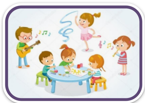
ВЕКТОР РОЗВИТКУ "ОРГАНІЗАЦІЙНЕ ЗАБЕЗПЕЧЕННЯ"

Стратегія в сфері якості освіти ЗДО реалізується через основні вектори розвитку: