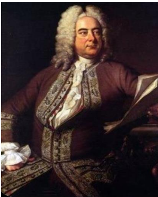
Георг Фрідріх Гендель

Пропонуємо вам порівняти два музичні твори. Обидва вони були написані у XVIII столітті відомими композиторами: німецьким автором Г. Генделем та італійцем Т. Альбіноні. Чи почуєте ви різницю між цими творами?