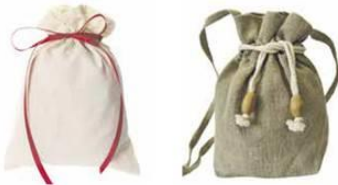
Мал. 1. Багаторазові мішечки-торбинки для різних продуктів

Сьогодні торбинки виготовляють різних розмірів, і мають вони різне призначення. Є такі, які використовують лише для окремих продуктів: хліба, овочів, сипких продуктів на вагу (цукор, борошно тощо) (мал. 1).