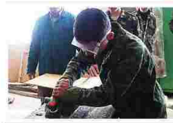
Електрогазозварник ручного зварювання