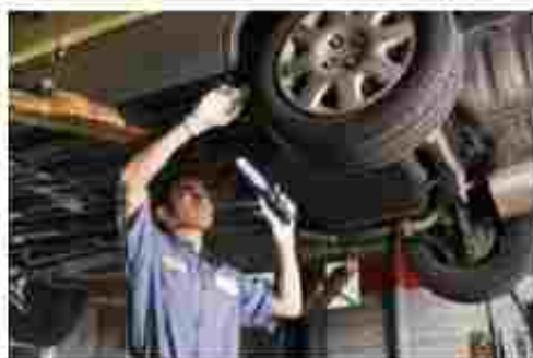
Слюсар з ремонту колісних транспортних засобів