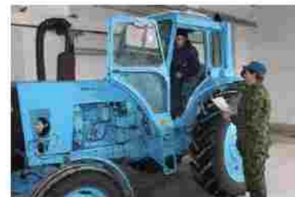
Слюсар з ремонту с/г машин та устаткування

Чемпион України за 2010 рік вул. Незалежності Сотні 8/1 м. Хорол, Полтавська обл., 37800