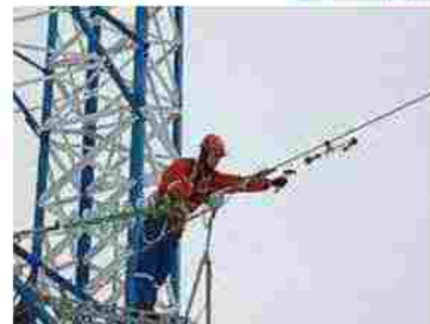
Діо. тяжник 6 ЯЗКУ