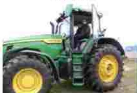
Тракторист-машиніст с/г виробництва