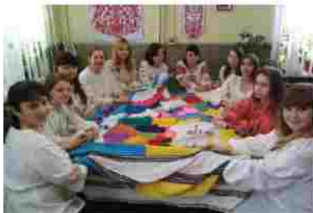
Г. чна вишивка