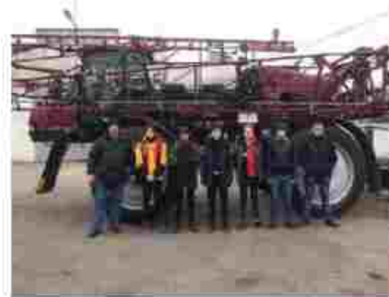
Тракторист-машиніст с/г виробництва категорії «А1», «А2», «В1»; слюсар з ремонту с/г машин та устаткування; водій автотранспортних засобів категорії «С»