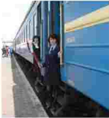
Дровідник пасажирського вагону