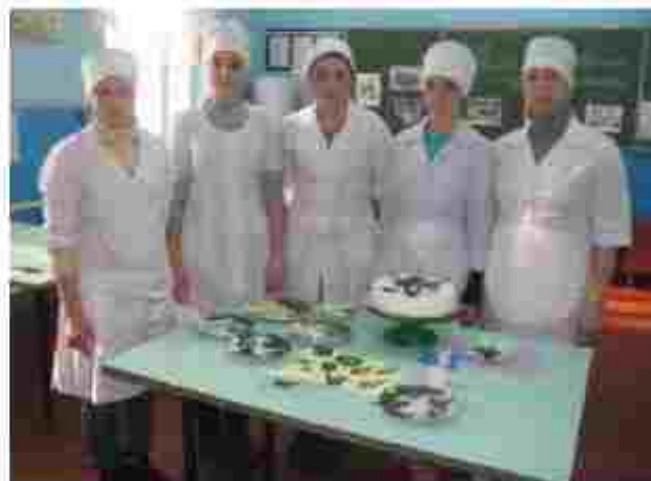
Здобувачі професії Кондитер