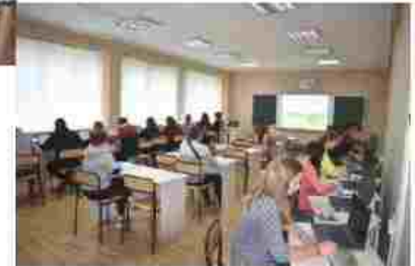
Оператор комп'ютерного набору