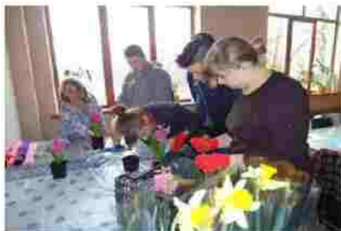
Квітникар Робітник зеленого господарства