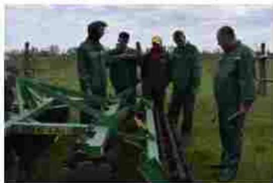
Слюсар з ремонту с/г машин та устаткування