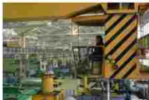
Машиніст крана (кранівник)

Чекаємо вас за адресами: м. Кременчук, вул. Чкалова, 4 а/с м. Кременчук, вул. Д. Захаренки, А. Овсатал, 5. тел. 76-52-49, 76-54-90 Моб. тел.: 097-97-543 11