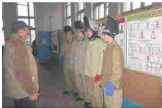
Електрик-ізобірник, електрик-зарядник на автоматичних та напіваавтоматичних машинах

Наша адреса: вул. Сакко, 16а, м. Полтава, 36015 Тел : (0532)51-2 / 20