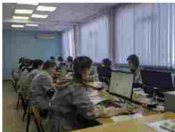
Операція з реєстрації бухгалтерських даних