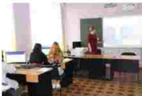
Обліковець з реєстрації бухгалтерських даних