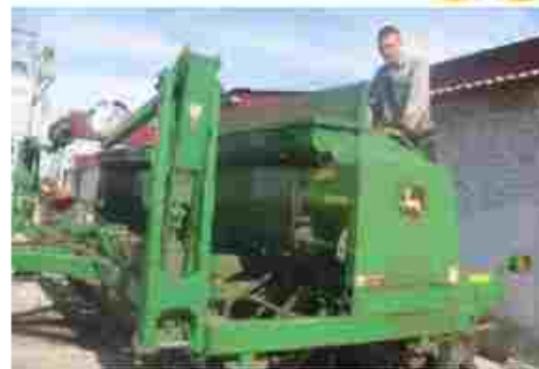
Слюсар з ремонту с/г машина та устаткування