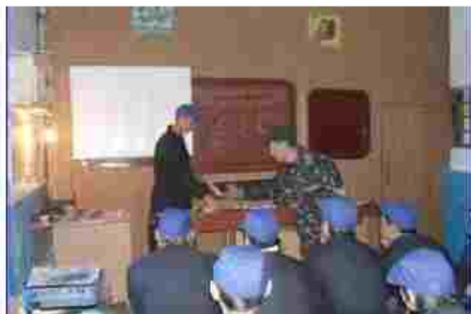
Стелювальник будівельний. Монтаси Голокартєвник: керівництво

Чкаємо вас за адресою: Вул. Інженерська 3, м. Лубені, Полтавська обл., 37500 Тел.: (0535) 17-18-58 E-mail: reception_dpl@ukr.net Сайт: dpl.ua