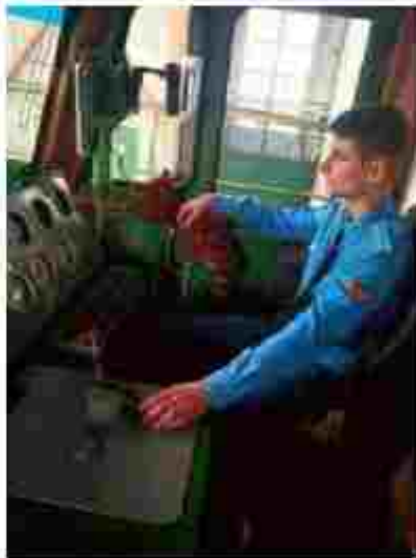
Машиніст електровоза (Помічник машиніста електровоза)

Чекаємо вас за адресою: проект Бавилова, 2, м. Полтава, 36004 Тел. факс: (0522) 63-96 55 05 1 080 17 28 Веб-сайт: https://ppl.poltava.ua E-mail: licey@ppl.poltava.ua Посилання на соціальні мережі: https://www.facebook.com/ppl.poltava https://www.instagram.com/poltava.transpo_tl_uceum/?hl=ru https://www.tiktok.com/@poltavaliceumoftansport