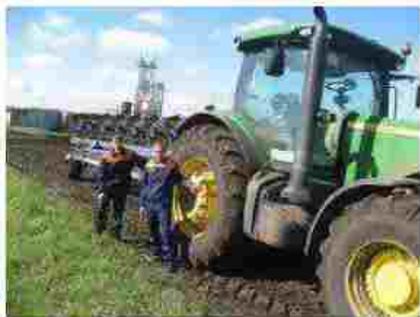
Тракторист машинист с/г виробництва

Чекаємо вас за адресою: вул. Центральна 30, с. Лазірки Оршанський р-н, П'ятиквська область, 57710 Тел.: (0-5057) 24-3-6 E-mail: sptu_46@ukr.net Сайт: http://www.ptu46lazirky.com.ua/