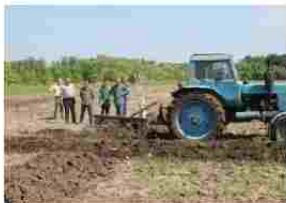
Тракторист-машинист с/г виробництва