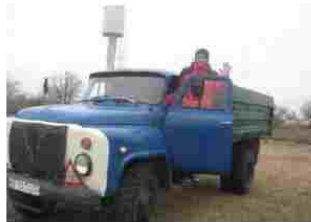
Водій автотранспортних засобів

Чекаємо вас за адресою: вул. Центральна 30, с. Лазірки Оршанський р-н, П'ятиквська область, 57710 Тел.: (0-5057) 24-3-6 E-mail: sptu_46@ukr.net Сайт: http://www.ptu46lazirky.com.ua/