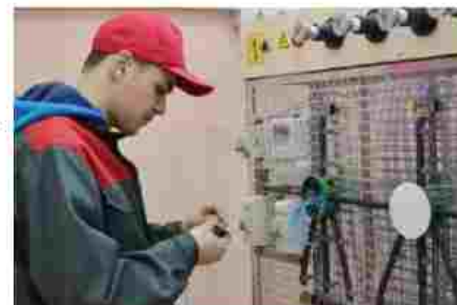
Електропримантер - ремонт та обслуговування електроустаткування

Чікаємо вас за адресою: вул. Видима Пушчова 14, м. Кременчук, Львівська область 39631 Тел.: +380981001177, +380536651121 Е-пошта: vpu7krem@gmail.com Сайт: www.pvpu7.ua Посилання на соціальні мережі: https://www.facebook.com/KrVPU7 https://www.instagram.com/vpu7_krem/