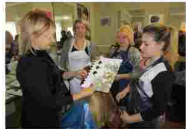
Перукар (перукар-модельєр), Манікюрник

Посилання на соціальні мережі: https://www.facebook.com/groups/294726264318480