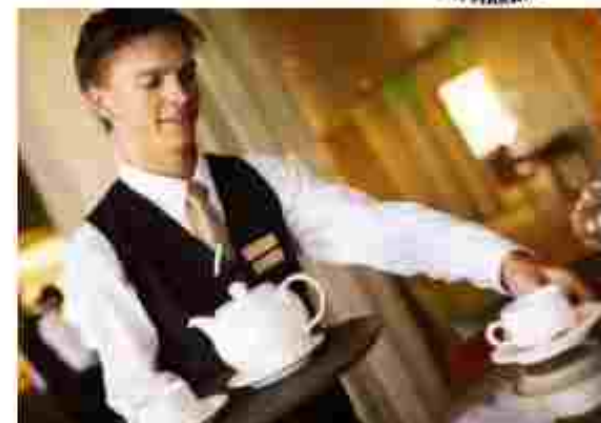
Маїстер ресторанного обслуговування