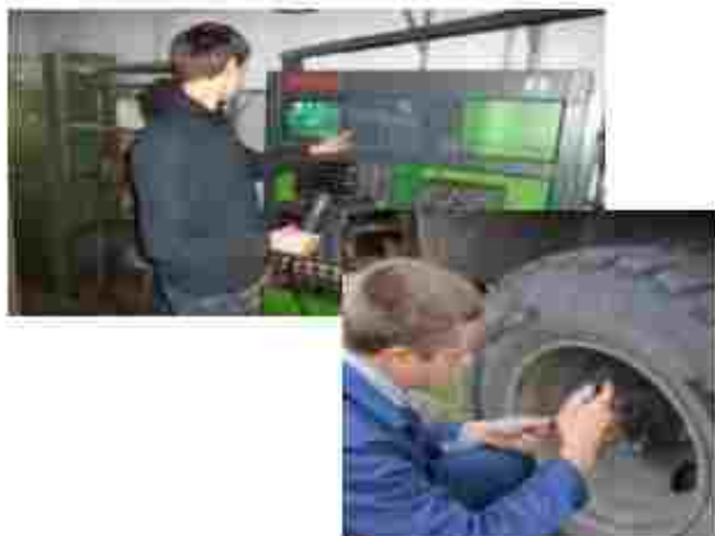
Слесар з ремонту колісних транспортних засобів