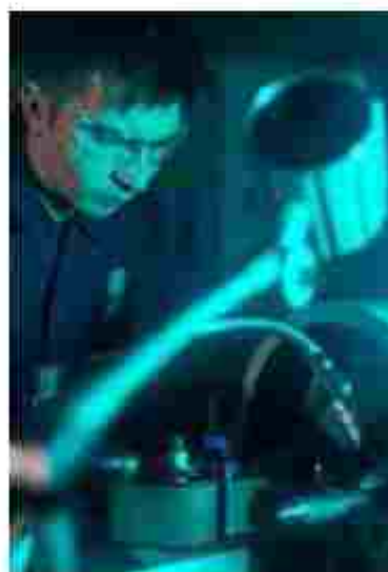
Слюсар з механоскладальних робіт. Слюсар-ремонтник

https://www.instagram.com/proffteh26?igshid=15zqeng3ibts9