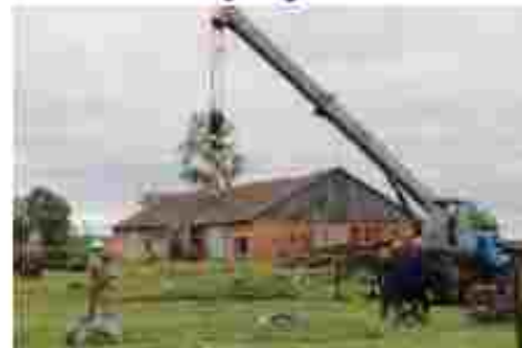
Машиніст крана автомобільного