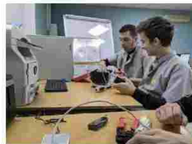
Оператор з обробки інформації та програмного забезпечення