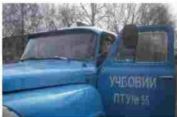
Водій автотранспортних засобів