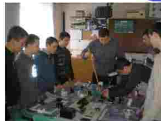
Електромонтер з ремонту та обслуговування електроустановок