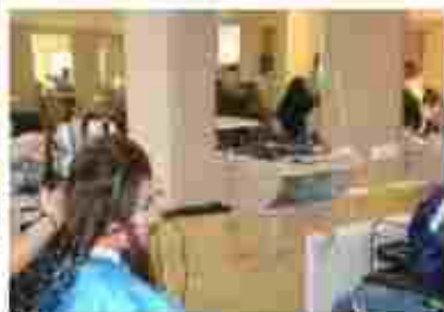
Перукар (перукар-модельєр). Візажист

Чекаємо вас за адресою: вул. Степового Фронту, 46, м. Полтава, 36002 Тел.: (0532) 68-10-10, 68-10-11 E-mail: ptu31p@meta.ua Сайт: http://ptu31p.at.ua/