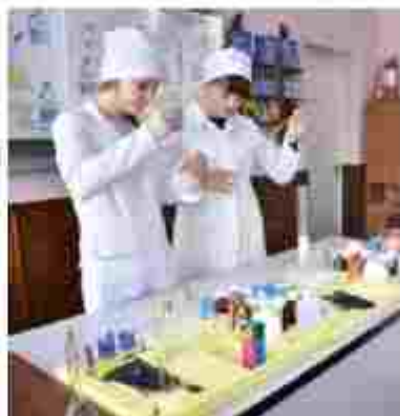
Лабораторія хіміко-бактеріологічного аналізу