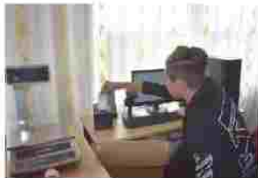
Касир торговельного залу

Чекаємо Вас за адр сою: вул. Радєвича, 20 м. Карлівка Львівська обл., 39500 т.ф. (05 46) 2-24-71 (05346) 2-47-76 Е.ма.: ka.p.tu50@ukr.net сайт: https://ptu50.org.ua/