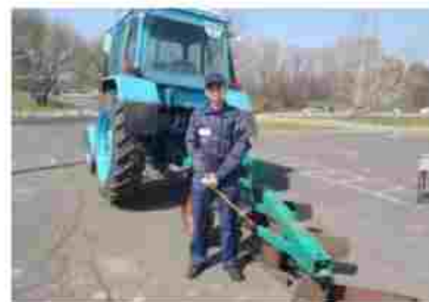
Слюсар з ремонту с/г машин та устаткування. Тракторист- машиніст с/г виробництва

Посилання на соціальні мережі: https://www.facebook.com/DNZPCPTO