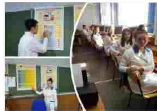
Оператор комп'ютерного набору, контролер-касир