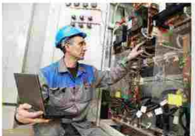
Електро. мотер з обслуговування електроустановок

Чекаємо вас за адресою: вул. Європейська, 9, м. Полтава, 36020 Тел.: (0532) 60-91-82 (0532) 60-92-4 E-mail: dze.rl@ukr.net Сайт: http://elektro-poltava.lycey.org.ua/ Посилання на соціальні мережі: https://www.facebook.com/profile.php?id=100045701600570