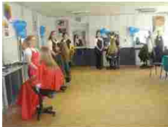
Перукар (перукар-модельєр). Манікюрник