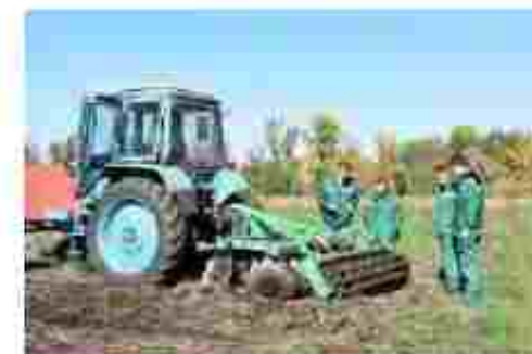
Тракторист-машиніст с/г виробництва