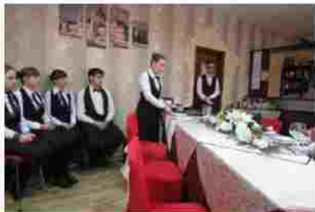
Майстер ресторанного обслуговування, кухар