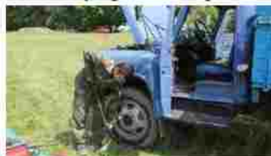
Водій транспортних засобів