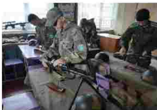
Слюсар з ремонту колісних транспортних засобів (з груп з посиленою військово- фізичною підготовкою)

Чеське свято за адресою: вул. Геннадія Біличенка, 27, Щермані, Полтавський район, Полтавська обл., 360116 Тел: (0532)59-84-22 E-mail: dn.pepto@ukr.net Сайт: https://pepto.org.ua