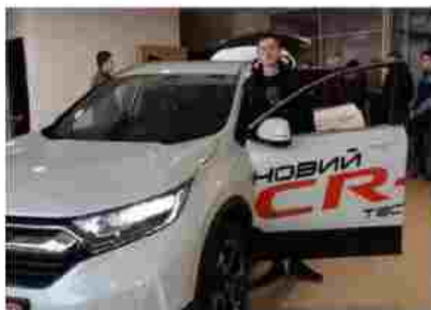
Водій автотранспортних засобів