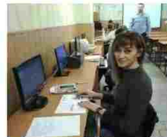
Секретар керівника (організації, установи, підприємства). Адміністратор

Чекаємо вас за адресою: вул. Степового Фронту, 46, м. Полтава, 36002 Тел.: (0532) 68-10-10, 68-10-11 E-mail: ptu31p@meta.ua Сайт: http://ptu31p.at.ua/