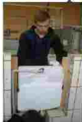
Монтажник санітарно-технічних систем і таткування