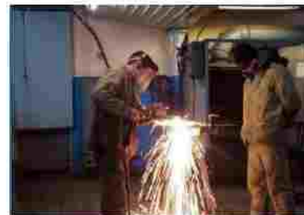
Електрозварник ручного зварювання