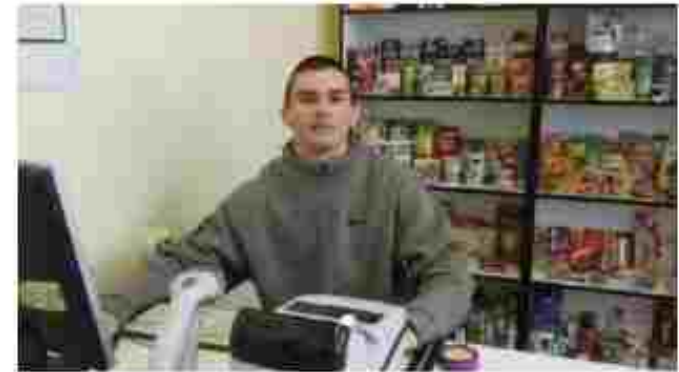
Оператор комп'ютерного набору. Контролер-касір