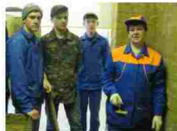
Муляр штукатур, лицувальник плиточник

https://www.youtube.com/c/Полтавськийпрофесійнийліцей