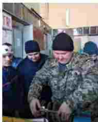
Слюсар з ремонту класичних транспортних засобів. Електрозварник