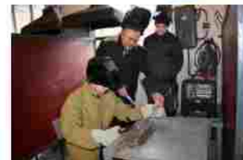
Електрозварник ручного зварювання