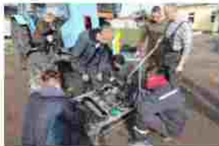
Слюсар з ремонту с/г машин та устаткування