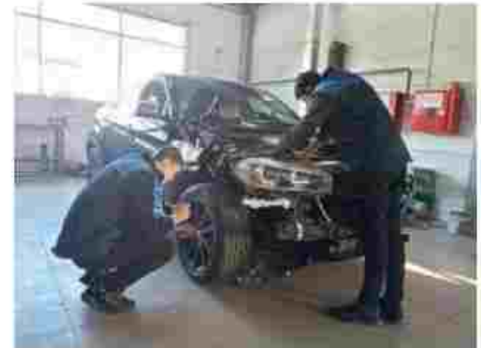
Слюсар з ремонту колісних транспортних засобів. Електрогазоварник

Чекаємо вас за адресою: проект Бавилова, 2, м. Полтава, 36004 Тел. факс: (0522) 63-96 55 05 1 080 17 28 Веб-сайт: https://ppl.poltava.ua E-mail: licey@ppl.poltava.ua Посилання на соціальні мережі: https://www.facebook.com/ppl.poltava https://www.instagram.com/poltava.transpo_tl_uceum/?hl=ru https://www.tiktok.com/@poltavaliceumoftansport