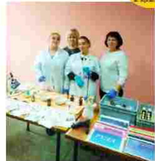
Лаборант хімічного аналізу