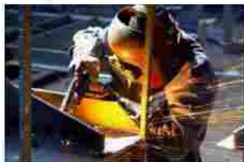
Електрогазозварник. Електрозварник на автомобільних та напівавтоматичних машинах