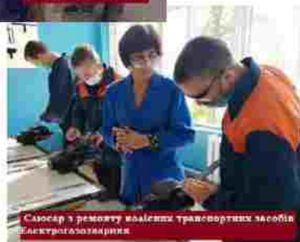
Слюсар з ремонту автомобільних транспортних засобів Електрогазозварник

Чек ємо вас з адресою: вул. Маршала Бірюзова, 90/14, м. Полтава, 36007 Тел.: (0532) 64 24-22 E-mail: pelta.aptu4@ukr.net Сайт: https://ptu4.com.ua/ Посилання на соціальні мережі: https://www.facebook.com/pof.15.polt