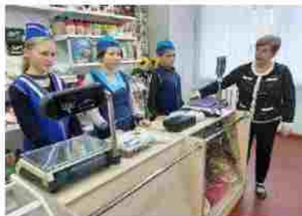
Продавець продовольчих товарів. Касир торговельного закладу