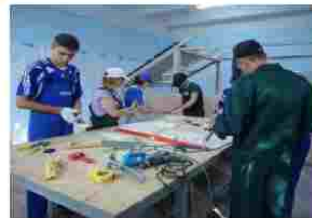
Монтажник гіпсокартонних конструкцій