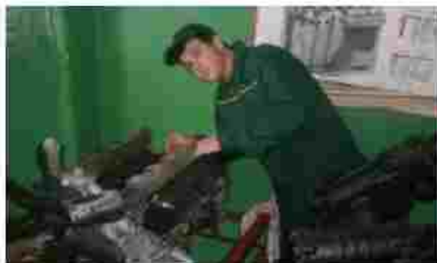
Слюсар з ремонту с/г машин та устаткування