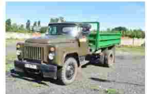
Водій вантажного автомобіля

Посилання на соціальні мережі: https://www.facebook.com/ptu50 https://www.instagram.com/ptu_50