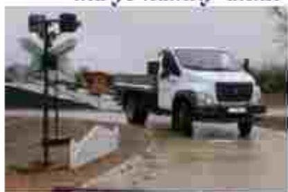
Водій автотранспортних засобів