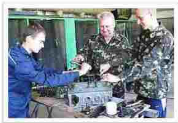
Стюсар з ремонту колісних транспортних засобів