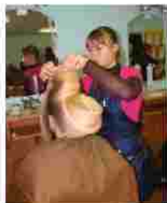
Перукар (перукар-модельєр). Манікюрник