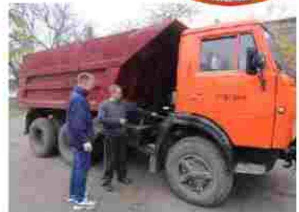
Водій автотранспортних засобів