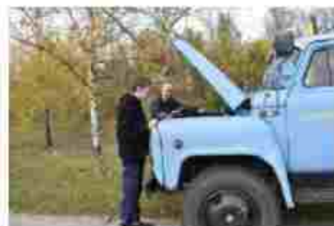
Водій автотранспортних засобів