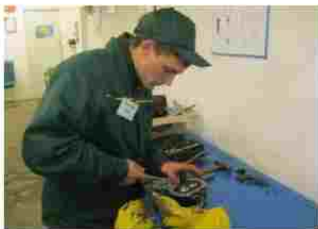
Тракторист-машиніст с/г в роботництві

Чкаємо Вас за адресою ву.: Козьцький шлях, 29, с. Яреськи Шишацький район, Мавська область, 35030