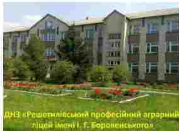
ДНЗ «Решетилівський професійний аграрний ліцей імені І. Г. Боровенського»