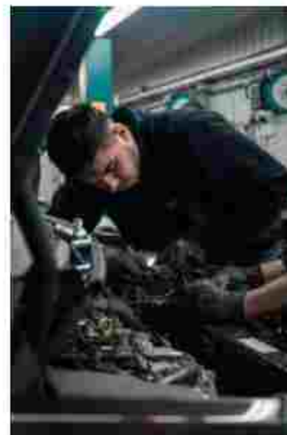
Слюсар-інструментальник. Слюсар з ремонту колісних транспортних засобів