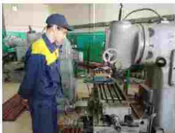
Верстатник широкого профілю