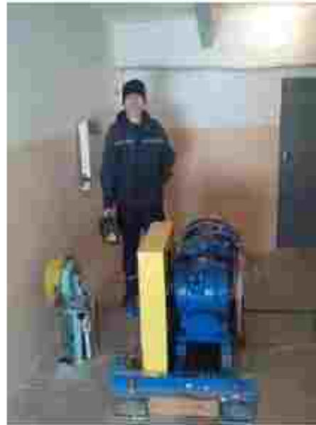
Електрик-ремонтник з ремонту та обслуговування електроустаткування.