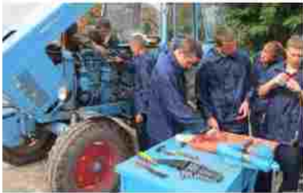
Слюсар з ремонту с/г машин і на устаткування