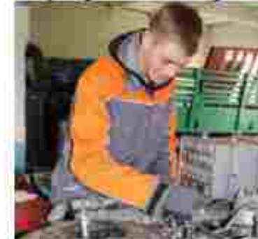
Слюсар з ремонту колісних транспортних засобів