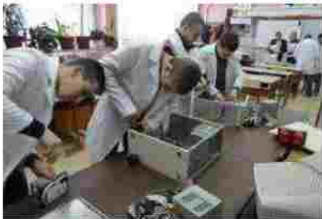
Елек. механік з ремонту та обслуговування ЛОМ