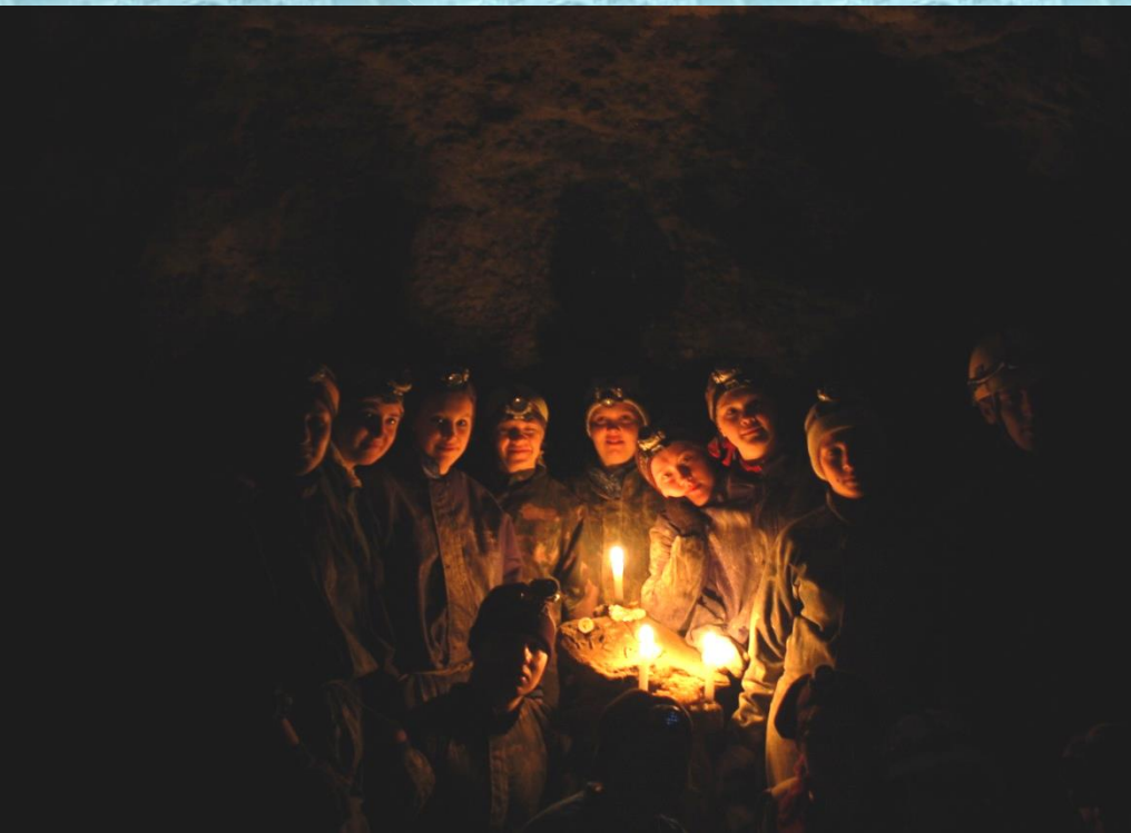
Підземний світ печери Атлантида