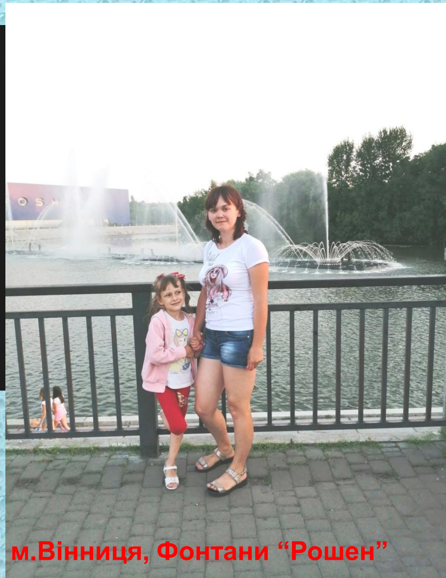
м.Вінниця, Фонтани "Рошен"