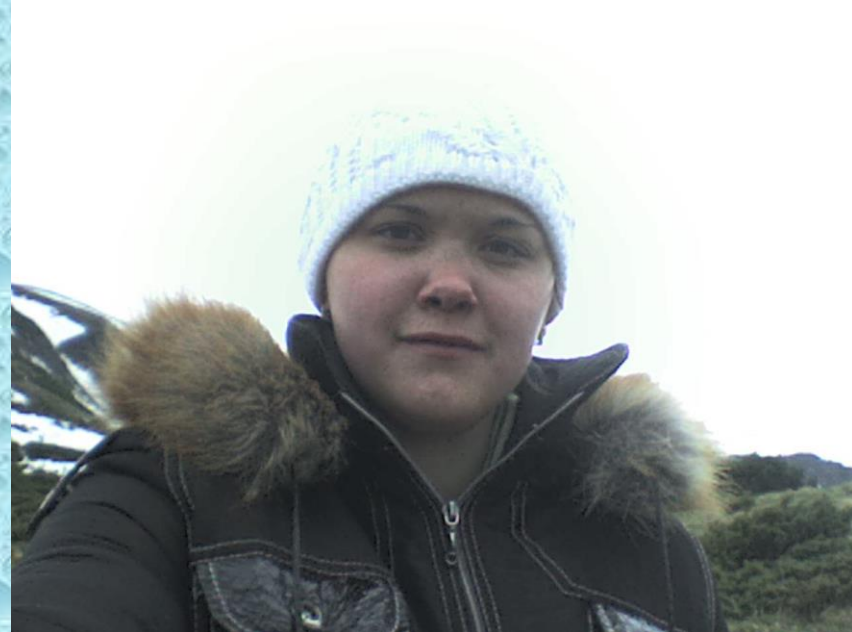
Похід на г. Говерла