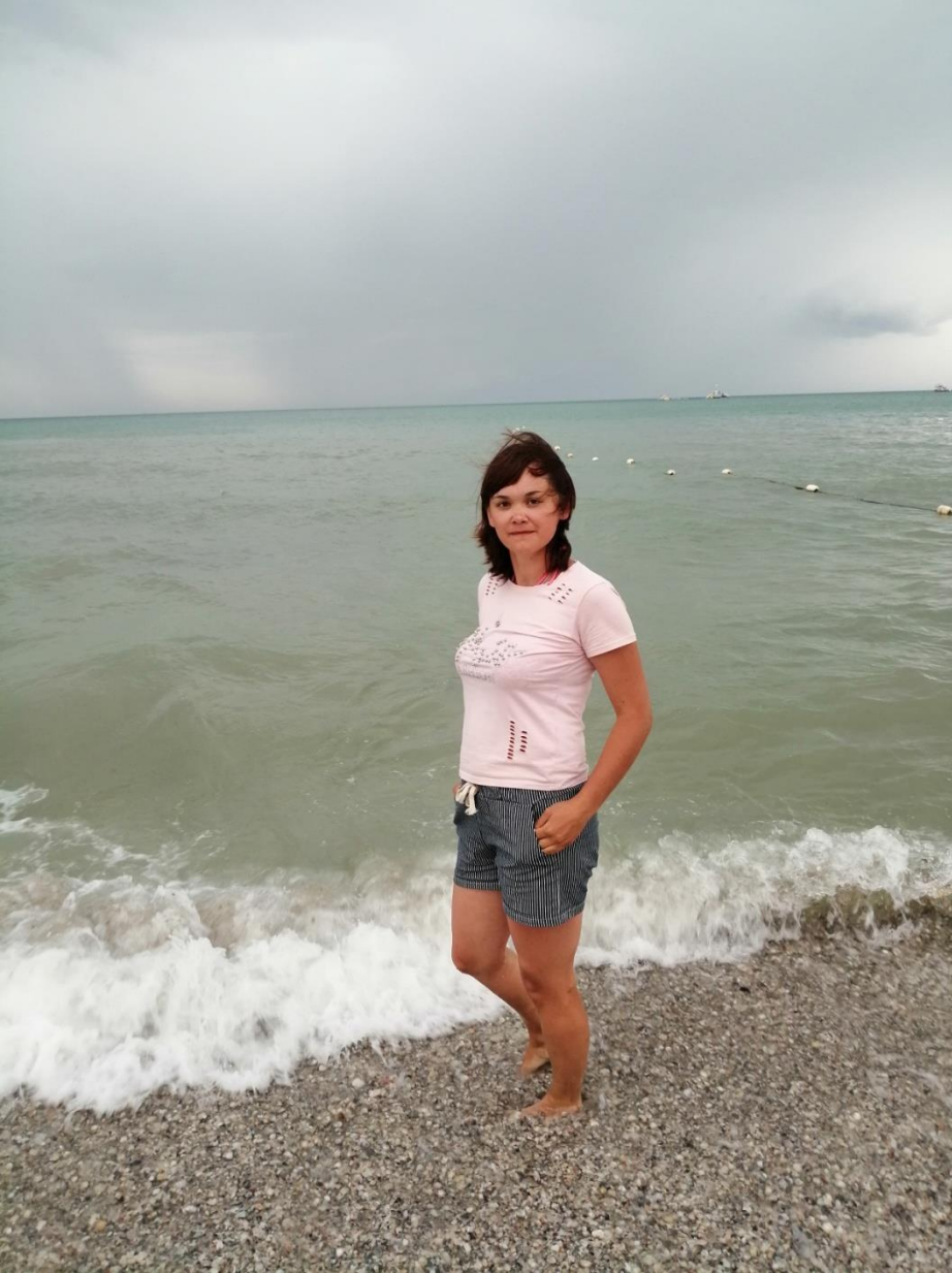
Південний берег України Залізний Порт