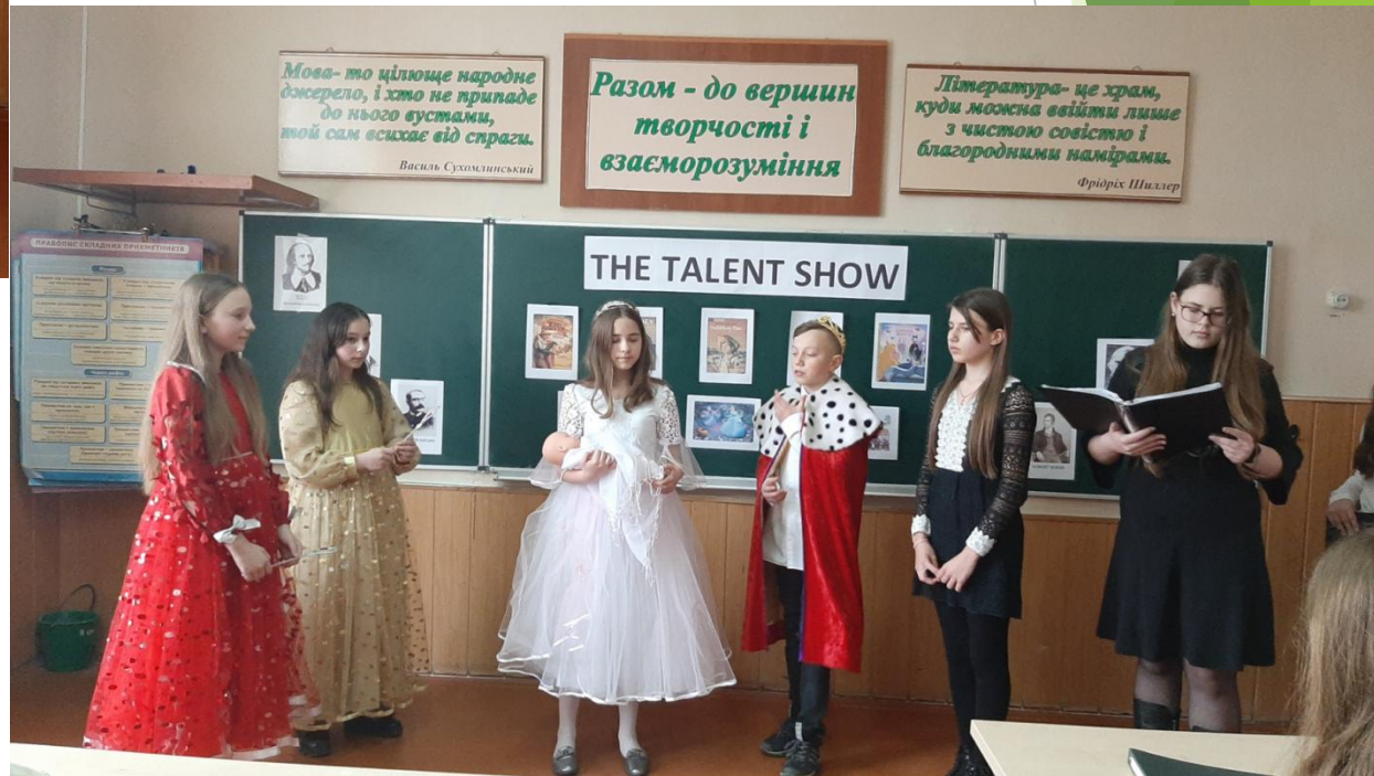
SLEEPING BEAUTY (The Talent Show)