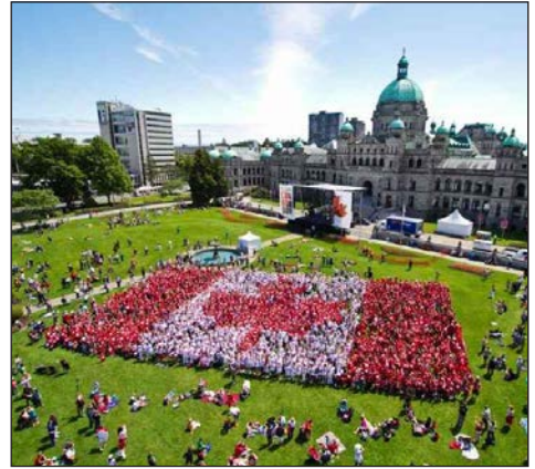
Сучасний прапор Канади з'явився у 1965 р.

Після розпаду СРСР Канада підтримала появу нових незалежних держав. 2 грудня 1991 р. вона визнала незалежність України.