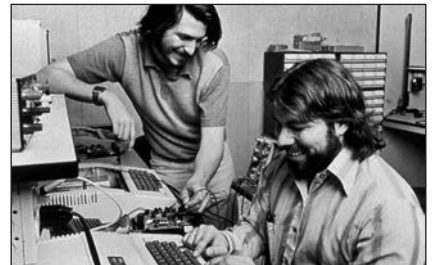
Стив Возняк і Стив Джобс

Криза 1973—1975 рр. спонукала країни Заходу до поглиблення економічної інтеграції. У 1970-х рр. остаточно затвердилася глобальна (без конкретних територіальних меж) економіка. Під її впливом національні економіки стали взаємозалежними. Світова економіка