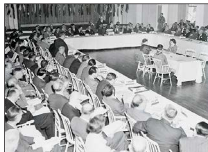
Заснування МВФ на Бреттон-Вудській конференції. США, 1944 р.

Починаючи з 1947 р. темпи економічного розвитку країн Заходу зростали. Упродовж 1948—1952 рр. сільське господарство західноєвропейських країн досягло довоєнного рівня, обсяг промислової продукції збільшився на 35 %, а експорт зріс удвічі. Період