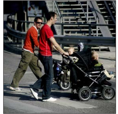
Соціальна модель Швеції забезпечує рівноправність чоловіків та жінок, зокрема в питанні догляду за дитиною

Витрати на утримання державного апарату й законодавчої влади чітко визначені та обмежені (у Кабінеті Міністрів — 11 автомобілів, у парламенті — три). Держава має позаблоковий статус. Система охорони здоров'я, яка вважається однією з найкращих у світі, безкоштовна і на 95 % державна; приватну практику мають лише 5 % лікарів. Швеція посідає перше місце у світі за витратами на розвиток освіти на одну особу. Обов'язковою є дев'ятирічна освіта, яку переважно здобувають у державних школах. Вищу освіту, яка фінансується державою, можуть отримати всі охочі за наявності середньої освіти. Вища освіта є безкоштовною, на її здобуття студентам надається допомога.