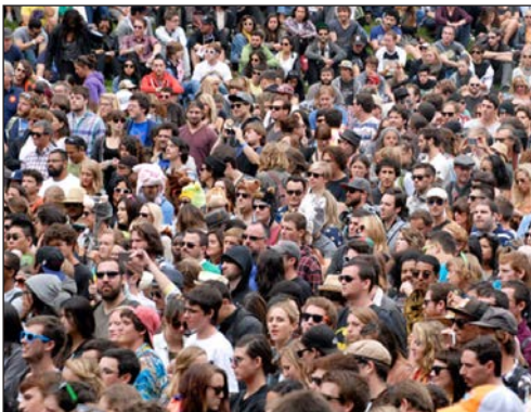
Високі темпи зростання населення — характерна особливість другої половини ХХ ст.

У другій половині ХХ ст. у країнах Західної Європи, що мають високий рівень життя, відчутним явищем суспільного життя стала новітня міграція. Африканський, індійський, іранський, турецький та інші народи, які спочатку приїздили сюди сезонно, переселялися назавжди зі своїх країн, де рівень життя був нижчим.