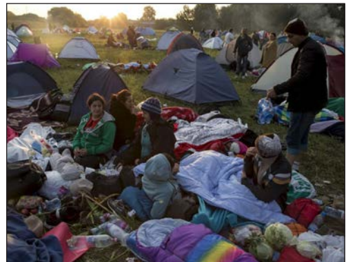
Табір біженців у Німеччині