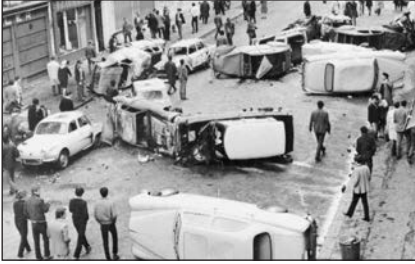
Перевернуті автомобілі після масових заворушень та демонстрацій студентів. 11 травня 1968 р.

За перше десятиліття П'ятої республіки суттєво змінилася структура населення. У сільському господарстві працювало 12 % активного населення. Майже третина його була зайнята в невиробничій сфері. Постійно покращувалося матеріальне становище населення.