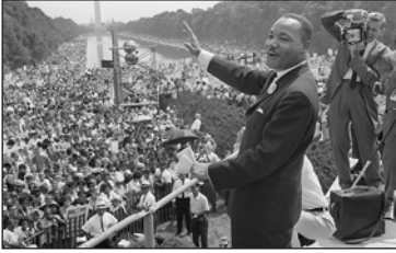
Мартін Лютер Кінг у поході на Вашингтон за громадянські права. 28 серпня 1963 р.

У 1955 р. два існуючі в країні профспілкові центри — Американська федерація праці (АФП) та Конгрес виробничих профспілок (КВП) — об'єдналися в організацію АФП—КВП. До неї належали 15 млн осіб.