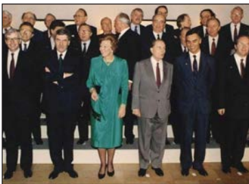
Глави європейських країн після підписання Маастрихтського договору. 7 лютого 1992 р.

Обговорення учасниками ЄЕС його майбутнього призвело до підписання в 1986 р. Єдиного європейського акта, який посилив європейську