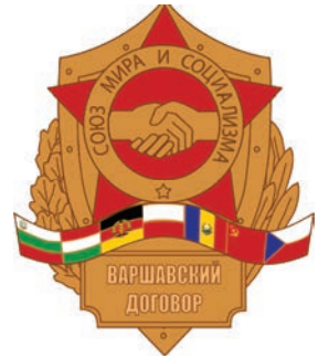
Логотип Організації Варшавського договору