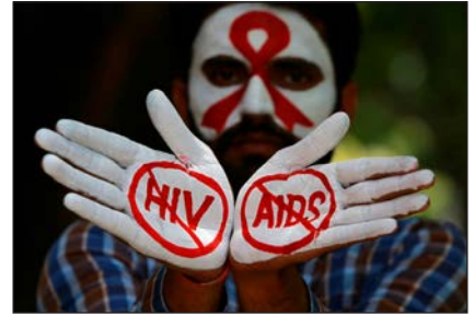
Студент бере участь у кампанії з інформування про ВІЛ/СНІД із нагоди Міжнародного дня пам'яті жертв СНІДу

У різних формах розвивалася в тогочасних країнах Заходу боротьба за права мовних і конфесійних меншин. Досить часто вона перепліталася з боротьбою національних меншин за свої права.