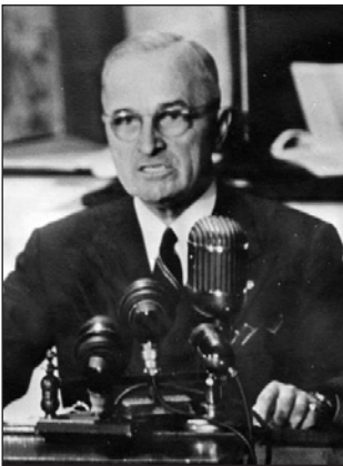
Гаррі Трумен під час промови у Конгресі 12 березня 1947 р.