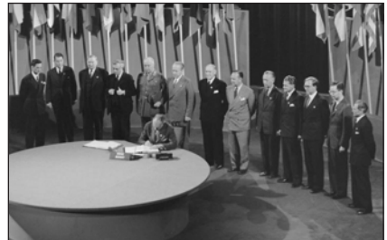
Підписання статуту ООН на конференції в Сан-Франциско. Квітень 1945 р.

Економічна і соціальна рада розглядала економічні й суспільні проблеми у світі, а Рада з опіки вирішувала справи підпорядкованих ООН 11 несамоїстих територій.