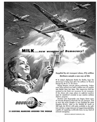
Плакат, присвячений повітряному мосту із Західним Берліном

Іншим конфліктом, який поставив США та СРСР на межу військового протистояння, стала Корейська війна 1950—1953 рр. Після завершення Другої світової війни Корею поділили по 38 паралелі на радянську та американську окупаційні зони. Коли окупаційні