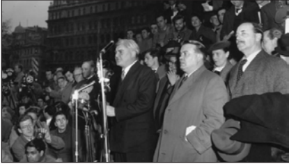
Антивоєнний мітинг на Трафальгарській площі з приводу Суецької кризи. Лондон, 4 листопада 1956 р.

на початку 1950-х рр. також досягло довоєнного рівня. У 2,5 разу зросли державні витрати на соціальне страхування. Влада запровадила безоплатну медичну допомогу населенню. Йому також гарантувалися пенсії за віком — жінкам із 60, чоловікам із 65 років. Надавалися допомога у зв'язку із втратою роботи, хворобою, народженням дитини, запровадили оплачувані відпустки. Розгорнулося широке житлове будівництво. Завдяки цим та іншим заходам матеріальне становище порівняно з довоєнними роками зросло. Однак досить великим залишалось й розчарування в суспільстві