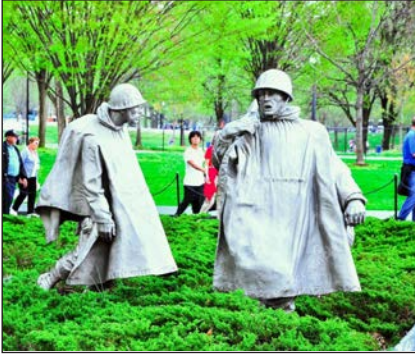
Меморіал Корейської війни у Вашингтоні, округ Колумбія (США)

війська було виведено, у Північній Кореї владу здобули комуністи, яких підтримував СРСР, у Південній Кореї влада орієнтувалася на союз зі США. При цьому обидва режими прагнули об'єднати півострів під своєю владою. У червні 1950 р. північнокорейські війська перейшли 38-му паралель і розпочали війну.