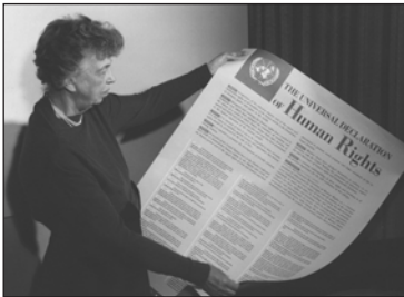
Елеонора Рузвельт із текстом Загальної декларації прав людини

4 Формування міжнародних стандартів із прав людини. Після завершення Другої світової війни, коли світ дізнався про злочини нацистського режиму, у Німеччині поширилося розуміння необхідності визначити невід'ємні права, які мають усі люди, і затвердити їх рішенням ООН. Комісія з прав людини створила з 18 осіб різних національностей і політичних поглядів редакційний комітет, який очолила дружина 32-го президента США Ф. Рузвельта Елеонора Рузвельт від США, відома у світі своєю правозахисною діяльністю. Робота над документом тривала два роки.