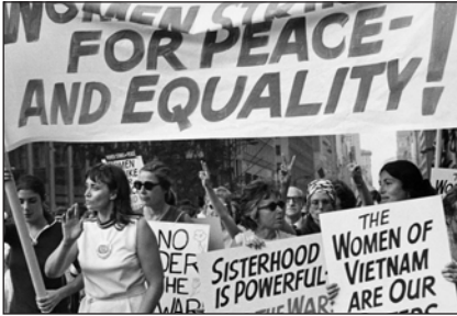
Жіноча демонстрація за рівноправність і мир. Нью-Йорк, серпень 1976 р.

обмеженість можливостей для суспільної і професійної самореалізації жінки. Книга здобула велику прихильність читацької аудиторії. Це дозволило Б. Фрідан пропагувати свої погляди, виступаючи з лекціями в багатьох країнах Західного світу.