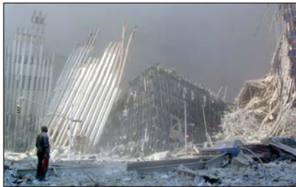
Руїни Всесвітнього торгового центру в Нью-Йорку після теракту 11 вересня 2001 р.

У межах внутрішньої політики адміністрація Дж. Буша-молодшого у 2001 р. розпочала масштабну реформу системи освіти. Відбулися також перетворення в галузі охорони здоров'я, зокрема, надавалася грошова допомога на придбання ліків американським громадянам. На президентських виборах 2004 р. Дж. Буш-молодший був переобраний на другий термін. Друге перебування на посаді стало ще складнішим, ніж перше. Чимало проблем виникло для США на міжнародній арені. У серпні 2005 р. у Новому Орлеані сталася повінь, через яку загинули сотні людей. Ця ситуація продемонструвала безпорадність влади.