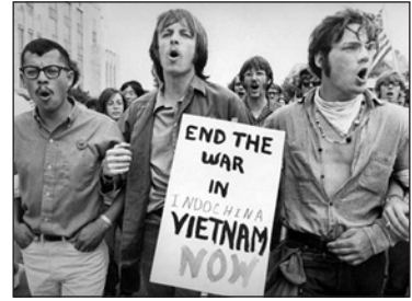
Студентські протести проти війни у В'єтнамі. 1960-ті рр.

Американський народ вважав президента Дж. Картера слабким, звинувачуючи його в тому, що він дозволив СРСР випередити США в гонці озброєнь й розширити свою експансію у світі. На виборах 1980 р. Дж. Картер програв. Новим президентом було обрано республіканця Рональда Рейгана .