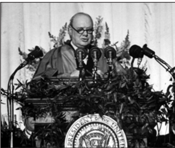
В. Черчилль під час промови в місті Фултон 5 березня 1946 р.