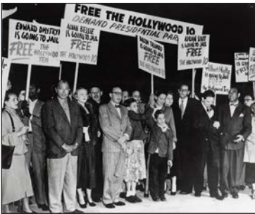
Протестувальники, заявивши про неприйняття маккартизму, вимагають свободи для діячів Голлівуду. 1950 р.

У протистоянні із СРСР адміністрація Г. Трумена дотримувалася рішучості й не поступливості. Однак Корейська війна, яка коштувала США мільярд доларів, десятки тисяч загиблих і поранених, негативно вплинула на його популярність серед американців. На виборах 1952 р. перемогу здобув республіканець Дуайт Ейзенхауер. Незважаючи на різку критику діяльності попередників,