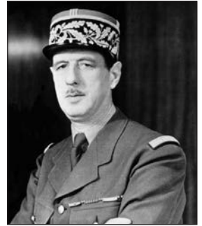
Шарль де Голль

Стимулювання розвитку економіки, відповідно до уявлень голлістів, відбувалося шляхом її державного регулювання. У наступні десять років (1958—1968 рр.) щорічні темпи зростання промислової продукції складали 5,5 %. Обсяги промислової і сільськогосподарської продукції за цей період збільшилися на 60—66 %.