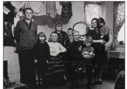
Ознаки кризи 1964—1979 рр. Три покоління родини живуть в одній кімнаті в напівпідвальному приміщенні. Ліверпуль, 1969 р.

Найбільшого суспільного розголосу в ці роки набув прийнятий у 1969 р. «Біль про