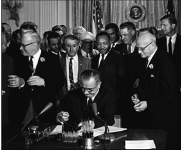
Ліндон Джонсон підписує Білл про громадянські права. 1964 р.

успіхи дозволили США до 1970 р. зберігати найвищий у світі рівень оплати праці.