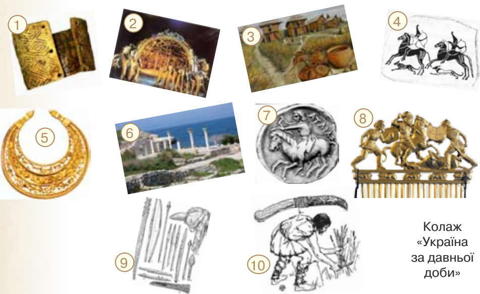
Колаж «Україна за давньої доби»

З IX ст. до н. е. і до початку I тис. н. е. в Північному Причорномор'ї та в Криму панували кочовики: кіммерійці, скіфи та сармати. Скіфи залишили нам на згадку скарби царських поховальних курганів. Сусідами греків і сарматів на півдні сучасної України були греки, які утворили міста-держави (поліси): Ольвію, Тіру, Херсонес, Пантикапей та ін. А на півночі України в середовищі землеробських археологічних культур формувалися початки давнього слов'янства.